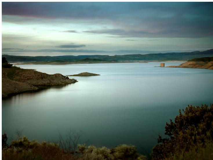
Torre de Floripe, Embalse de Alcántara (Cáceres)

Del 2 de septiembre al 4 de octubre de 2009 VOLUMEN EN LA SOMBRA CARLOS CRIADO