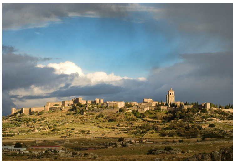
Vista nocturna de Cáceres