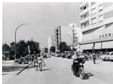
Una mirada al Móstoles de ayer (pgs. 20-21)