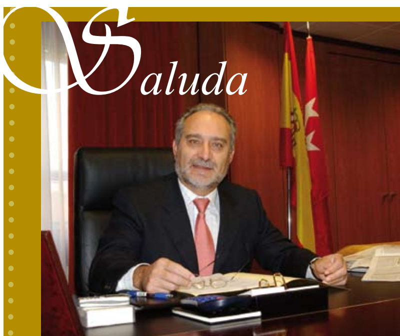
Esteban Parro del Prado, Alcalde de Móstoles