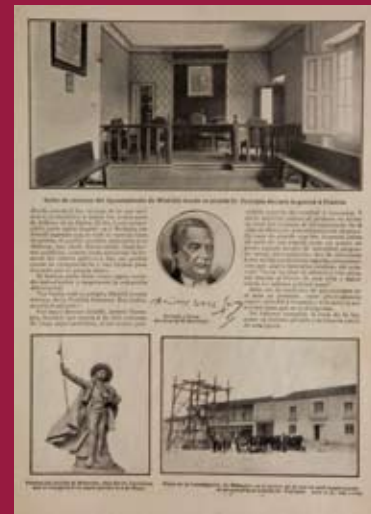
Salón de Plenos