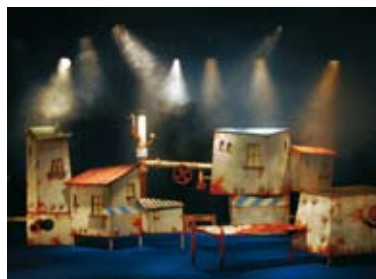
Escuela de Salud, Viajes, Cine, Teatro... (Pgs. 33-39)