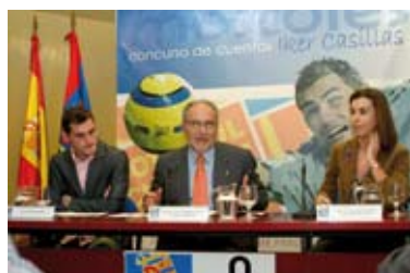
Concurso de cuentos "No soy Galáctico, soy de Móstoles" (Pgs. 14-15)