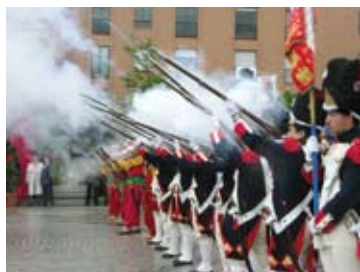
Móstoles, pasión por la Libertad (pg. 13)