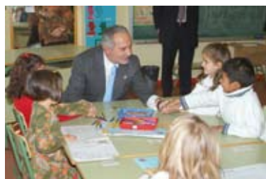
Huellas del Bicentenario (pgs. 6-13)