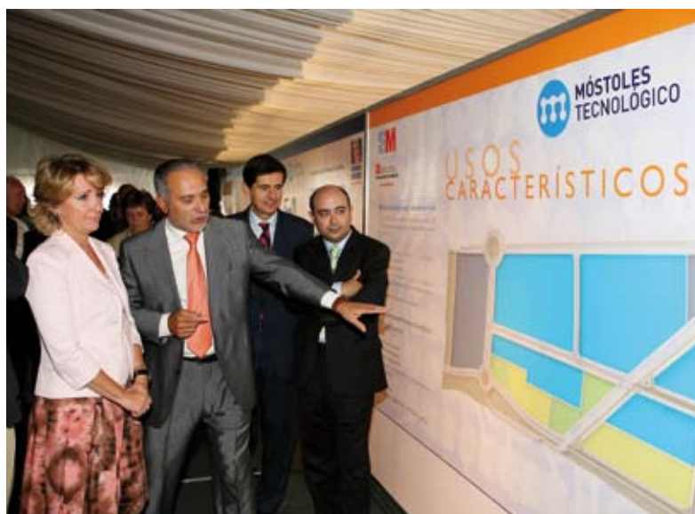
El Alcalde de Móstoles, Esteban Parro, explica a la Presidenta de la Comunidad, Esperanza Aguirre, detalles del Parque Tecnológico

E l Parque Móstoles Tecnológico, uno de los proyectos empresariales más ambiciosos de España, concentrará 100 empresas, muchas de ellas punteras en inversión tecnológica y creará 3.000 puestos de trabajo. Con 670.000 metros cuadrados de superficie, esta iniciativa creará una zona empresarial cuyo motor será la investigación tecnológica.