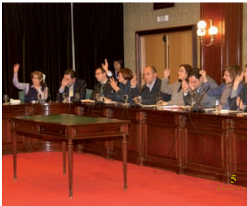
► Los miembros de la Corporación durante la votación de los Presupuestos

Por el contrario, todos los capítulos correspondientes a gastos corrientes (gastos de personal, compras de bienes y servicios, gastos financieros y transferencias corrientes) disminuyen sensiblemente.