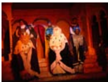
Pág.20 y 21-► La Navidad en imágenes