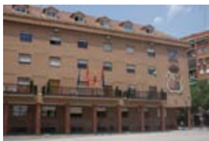
► El Ayuntamiento congela los impuestos. Página 10.