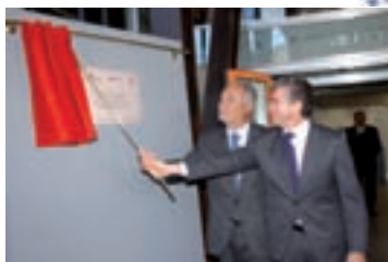
Pág. 11-► Nuevo Instituto de la Mujer