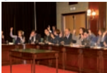
Pág.6-► Presupuestos restrictivos y austeros para 2010