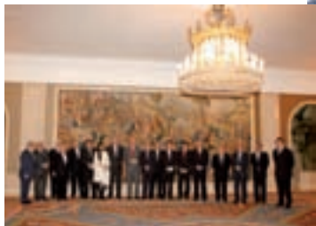
Págs. 18.-► SM El Rey, I Premio de la Convivencia