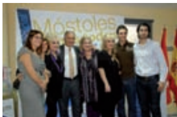
Pág. 8.-► Restaurante Municipal