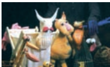
Pág.36 -40.-► Toda la programación cultural y de ocio