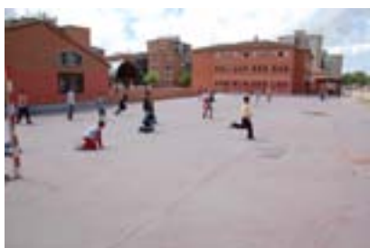
► Nuevas Escuelas Infantiles Página 22.

El Ayuntamiento ahorra 13,2 millones en sueldos de la Corporación, gastos de publicidad, protocolo, imagen, telefonía móvil, personal y obras en la calle