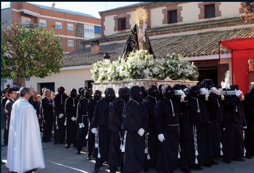
La Procesión del Encuentro se celebra tradicionalmente todos los Domingos de Resurrección con la imagen de la Soledad, que parte desde la Parroquia, y la del Resucitado desde la Ermita Nuestra Señora de los Santos.