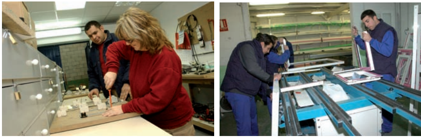
El nuevo programa de talleres de empleo contempla 95 cursos diferentes.