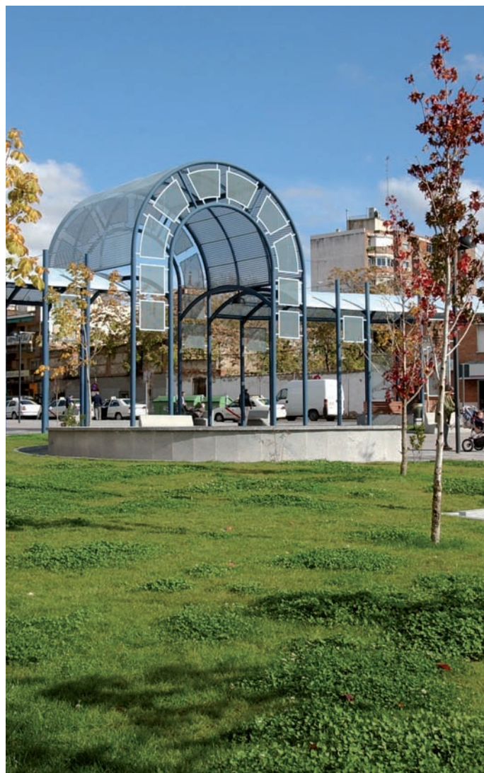
Vista parcial de los jardines de la Plaza del Pradillo.

El Plan de Movilidad Urbana Sostenible es un plan ambicioso que ha contado con una amplia participación de los vecinos en su elaboración, pues es una necesidad imperiosa la colaboración ciudadana y la sensibilización a la sociedad de las mejoras que implica dicho Plan para conseguir una ciudad amable, limpia y sostenible.