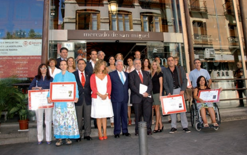
Los ganadores de los premios de la V edición del concurso “Madrid Región Comercial”.