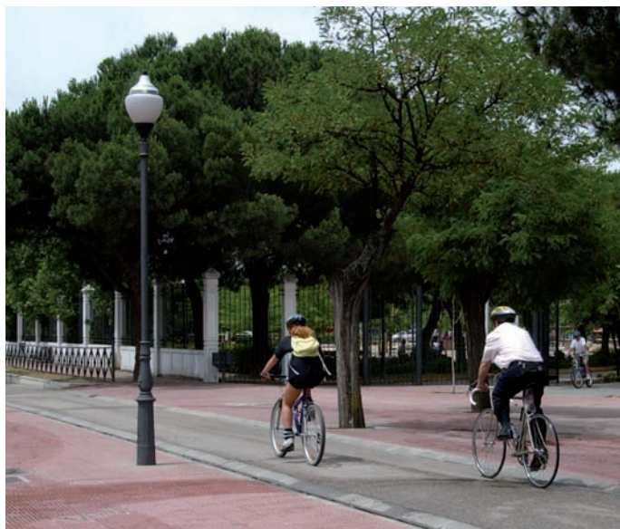
Carril bici junto al Parque Finca Liana.

El Plan de Movilidad Urbana Sostenible, junto con el Plan Estratégico, marcarán la vida de todos nosotros y nos dibujarán la ciudad amable y cálida donde todos soñamos siempre con vivir. Es el mejor aval que los mostoleños van a tener de que esta ciudad tiene asegurado un futuro de calidad de vida”, ha dicho el Alcalde Esteban Parro.