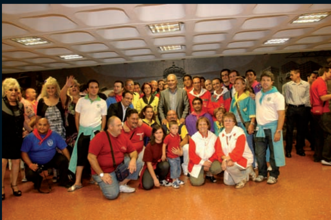
Representantes de las peñas con el Alcalde de Móstoles, Esteban Parro y Las Supremas.