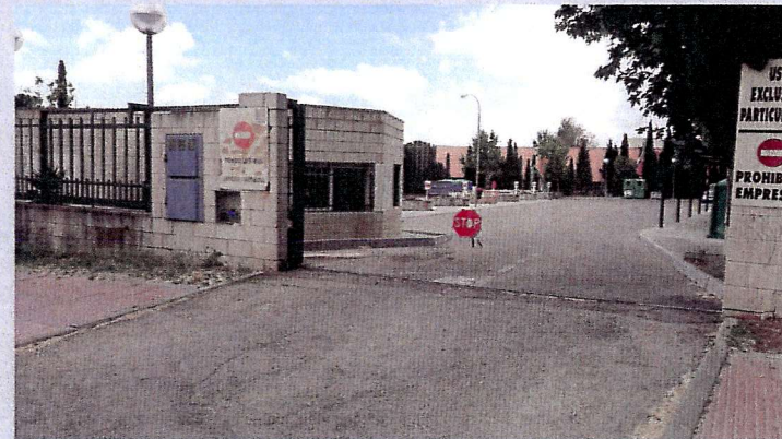
PUNTO LIMPIO: Pº Arroyomolinos c/v c/ Río Guadiana