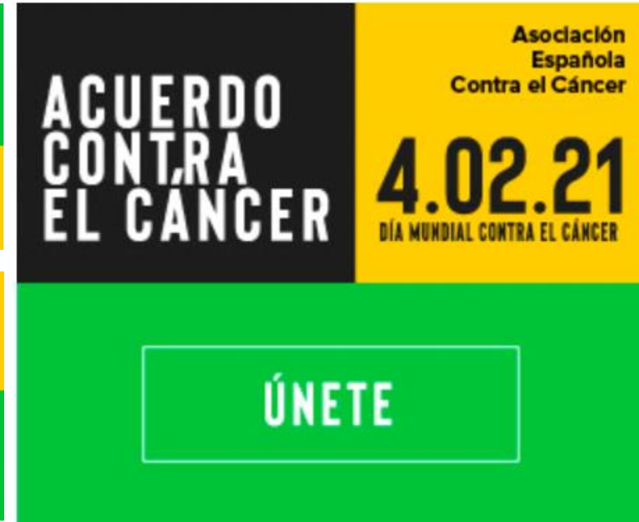
Banner y piezas para RRSS