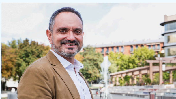
MANUEL BAUTISTA ALCALDE DE MÓSTOLES

Desde el Ayuntamiento de Móstoles, seguimos comprometidos con el bienestar de nuestras familias, apoyando actividades que fortalezcan la convivencia y el desarrollo de nuestros ciudadanos. Les invito a disfrutar de todas las propuestas que aquí encontrarán, con la esperanza de que sean el principio de muchas experiencias inolvidables.