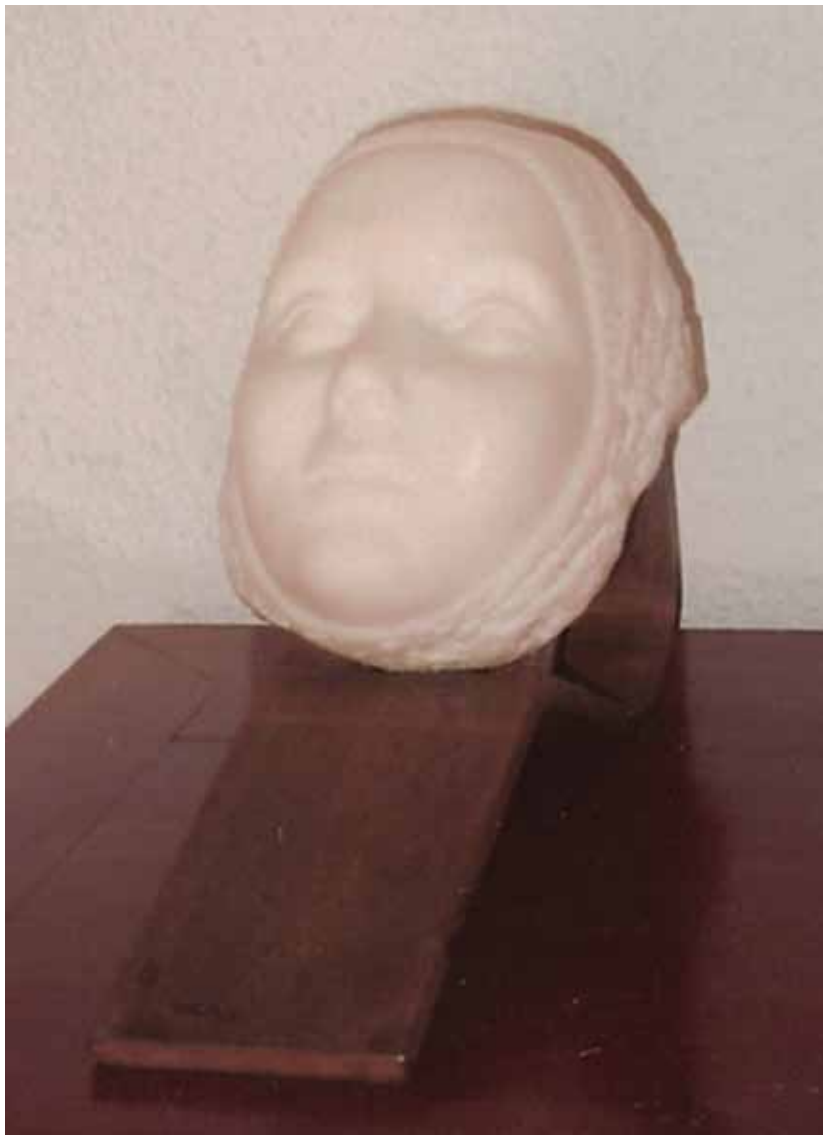
Claudia 2010 Mármol 25 x 15 cm.