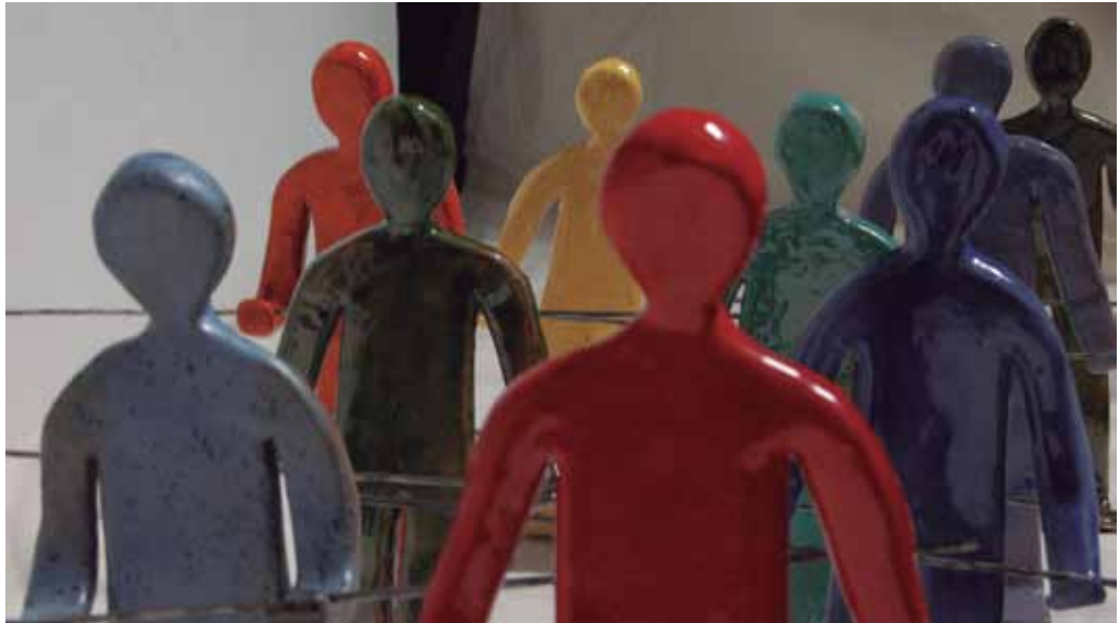
Funambulistas 2012 Barro rojo y esmaltes 20 piezas de 40 cm.