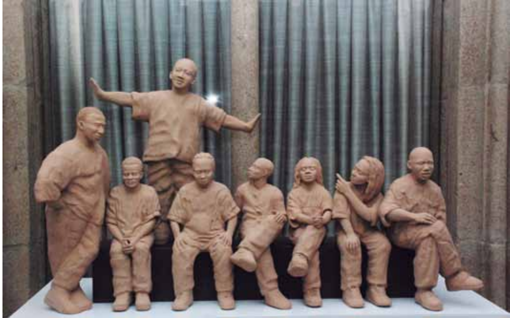
Grupo musical solidario 2008 Barro refractario con pátina acrílica 128 x 84 cm.