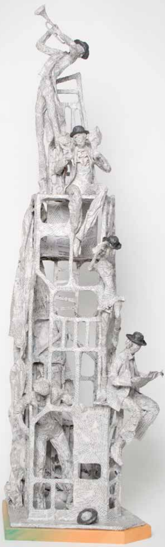
XV Concurso Pieza Única de Artesanía