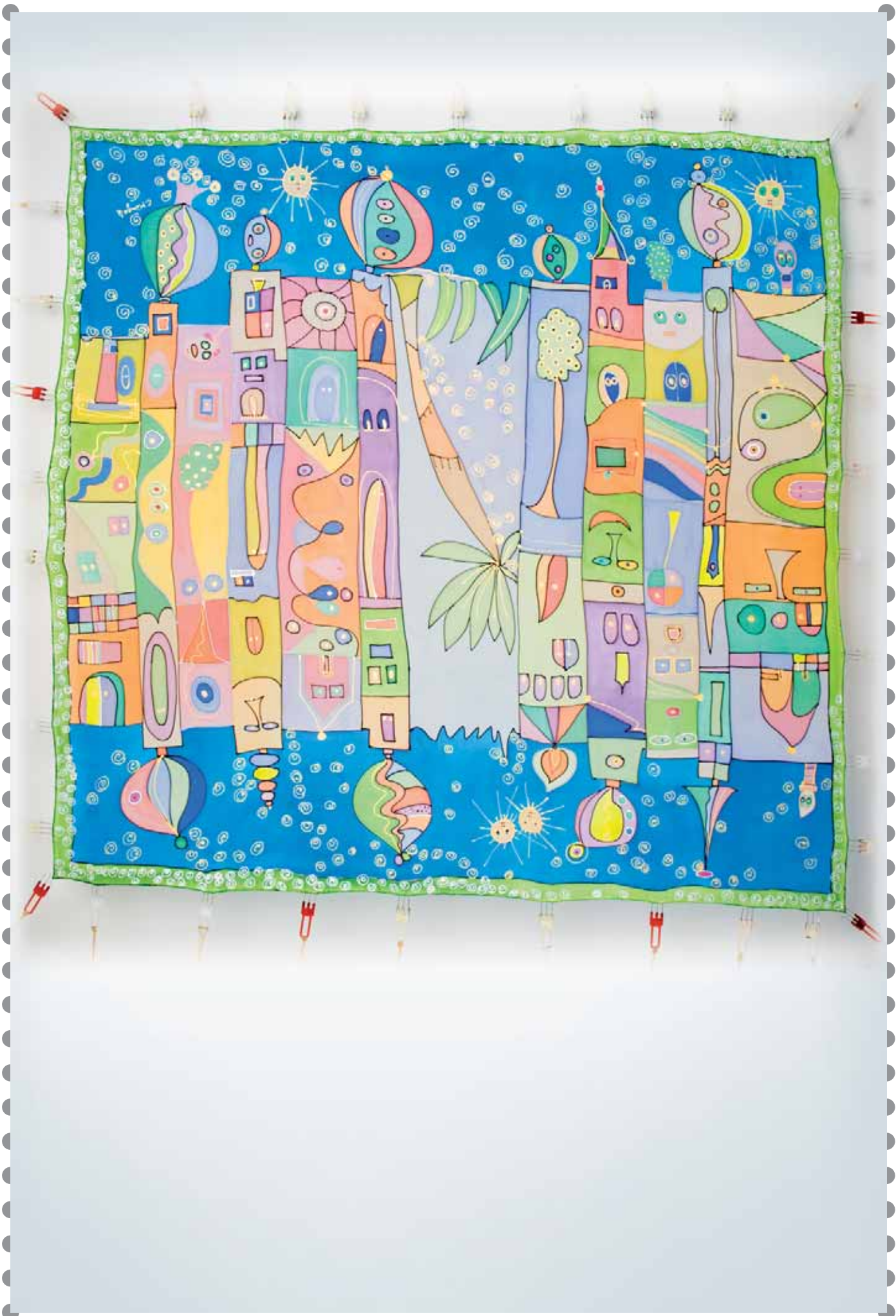
XV Concurso Pieza Única de Artesanía