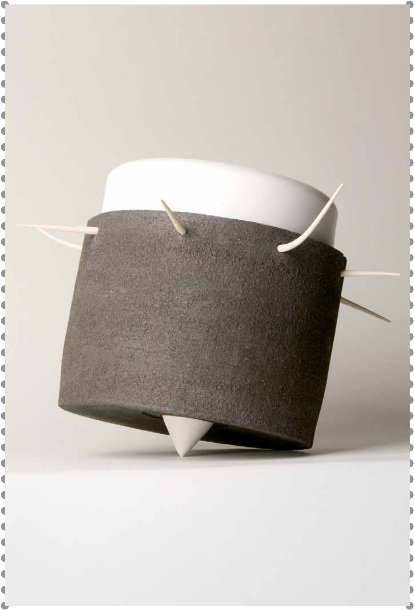
XV Concurso Pieza Única de Artesanía