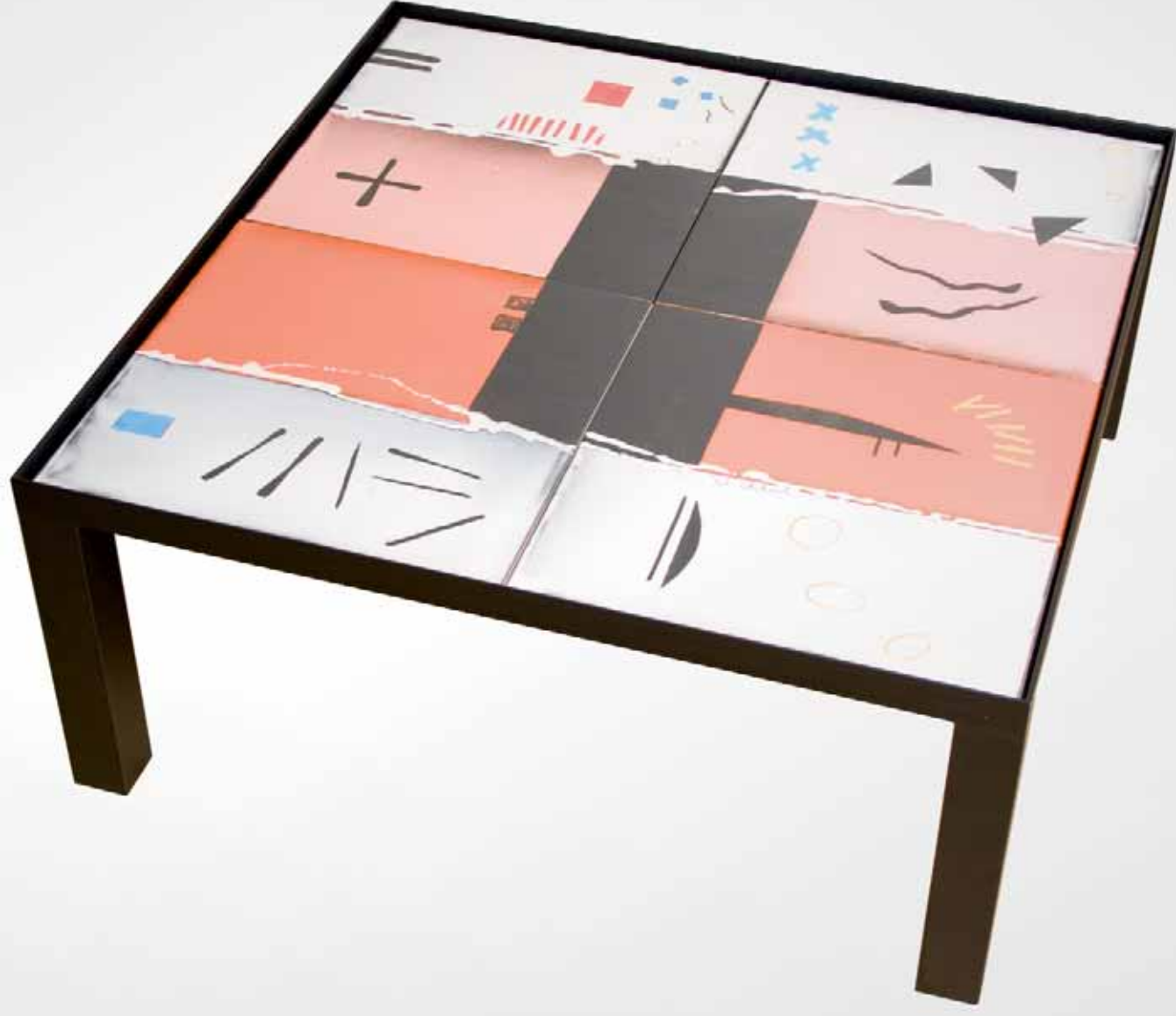
XV Concurso Pieza Única de Artesanía