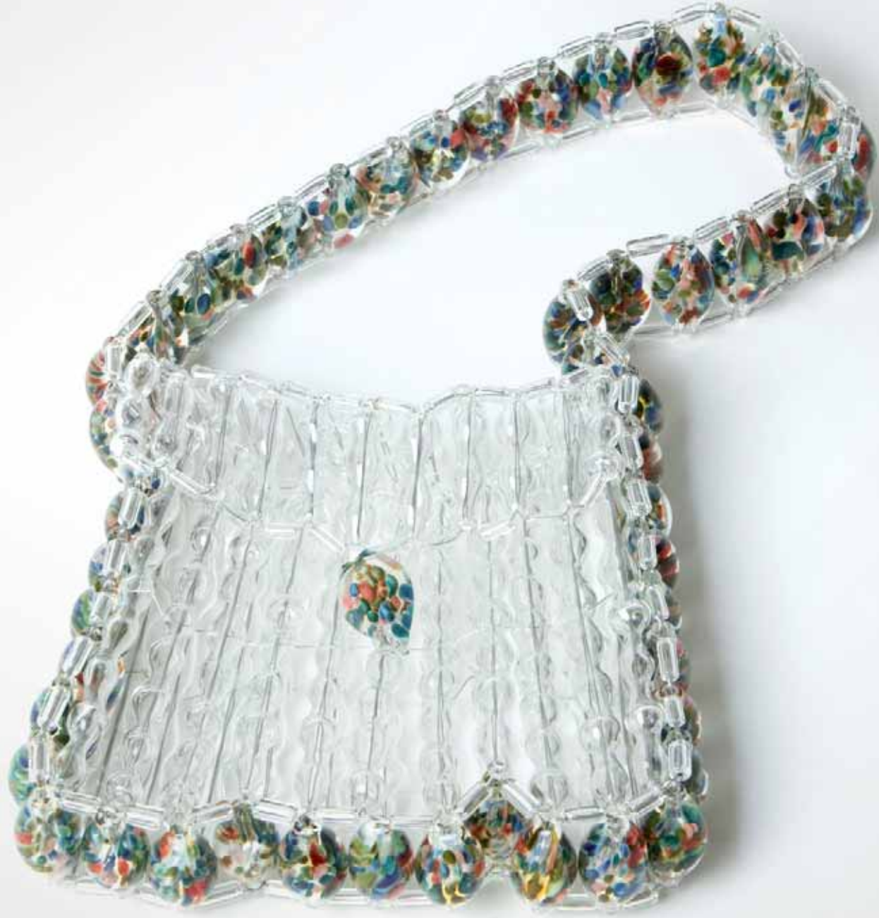
XV Concurso Pieza Única de Artesanía