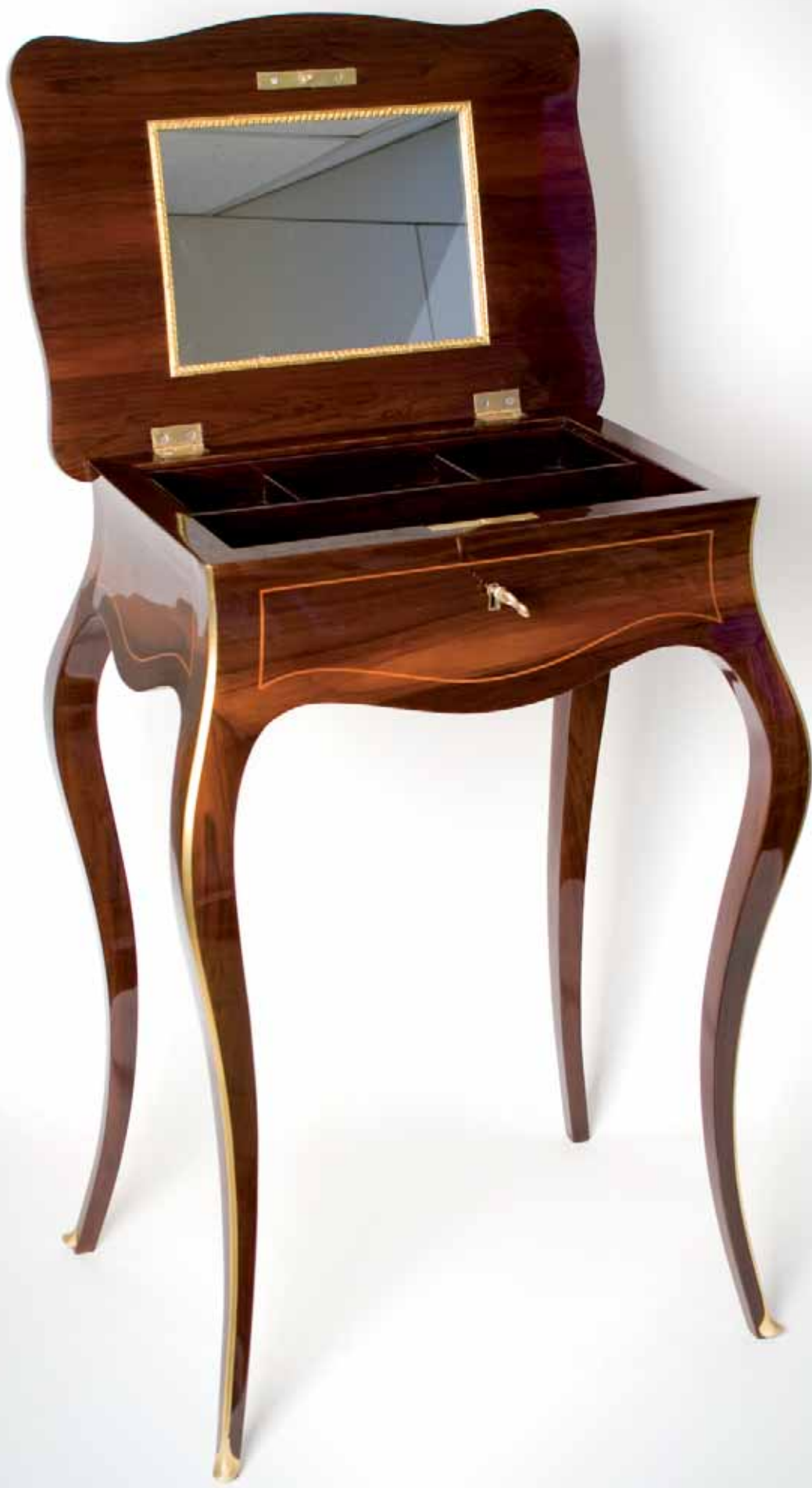
XV Concurso Pieza Única de Artesanía