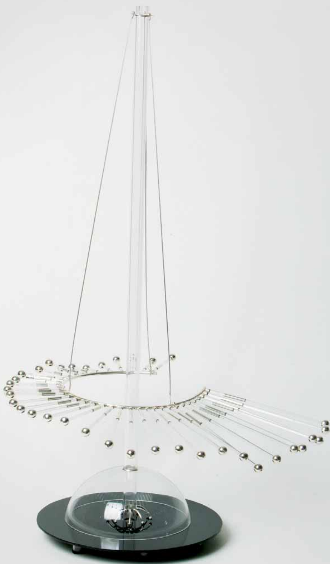
XV Concurso Pieza Única de Artesanía