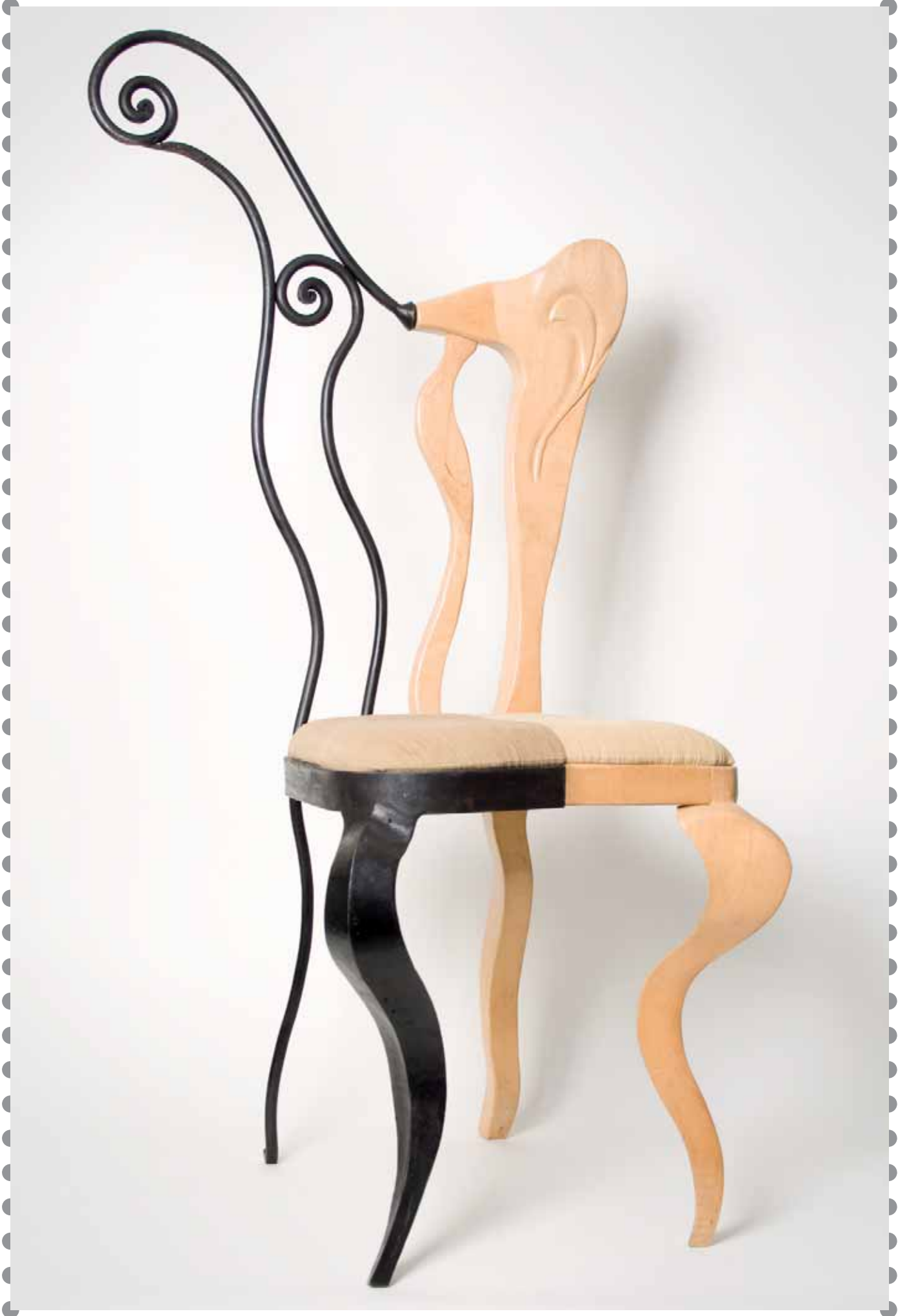
XV Concurso Pieza Única de Artesanía