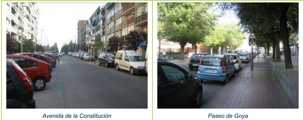
Avenida de la Constitución