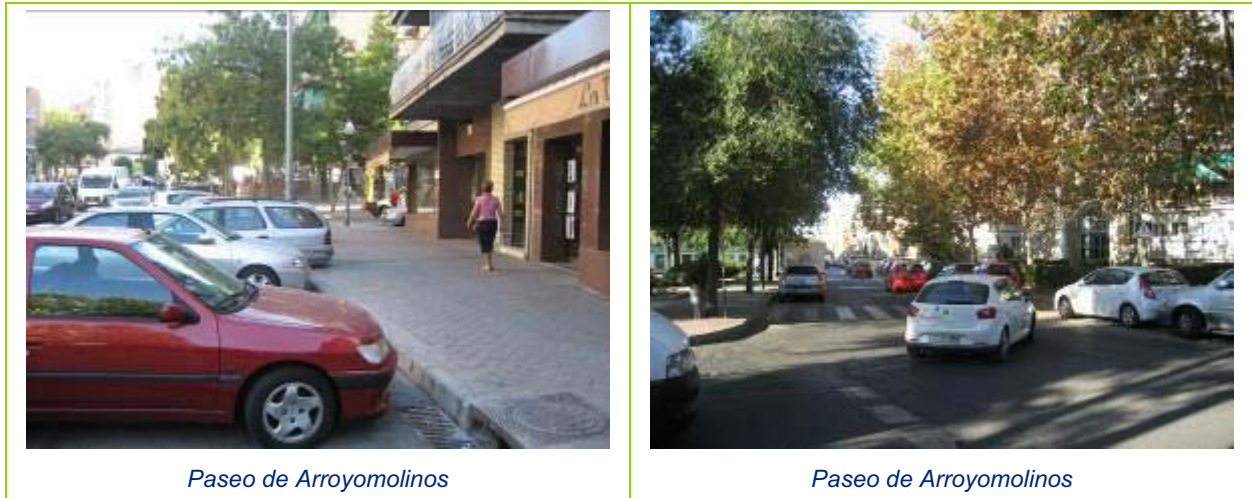
Paseo de Arroyomolinos