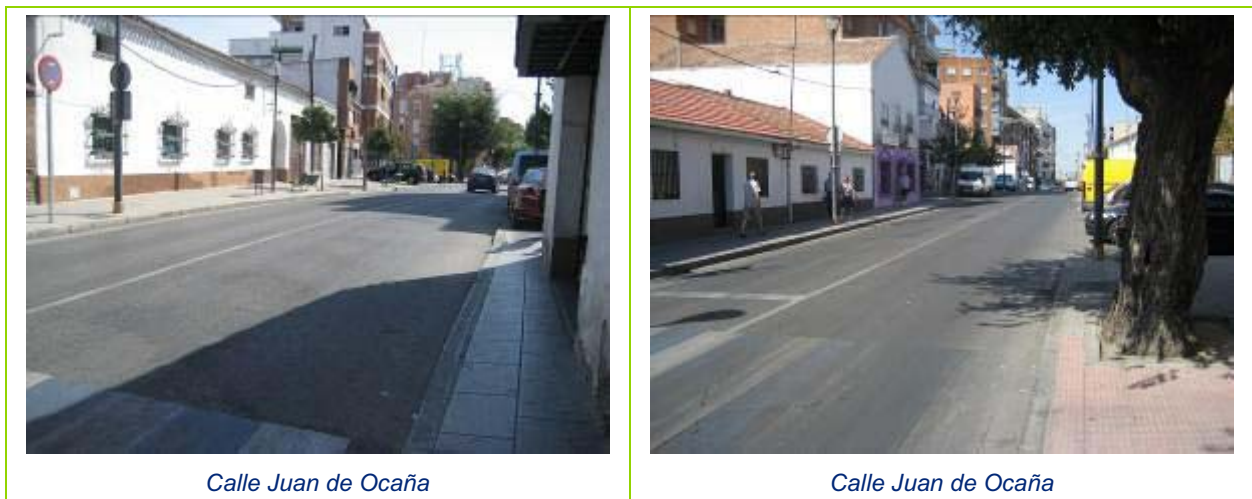
Ilustración 22 Itinerario 9. Juan de Ocaña- Avenida de los Deportes