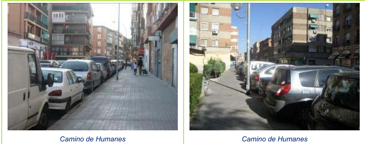
Ilustración 18 Itinerario 5. Camino de Humanes