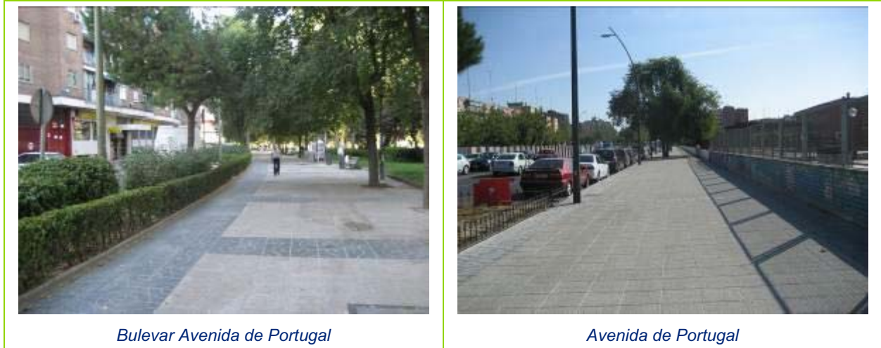
Bulevar Avenida de Portugal