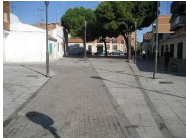
Área Peatonal Andrés Torrejón