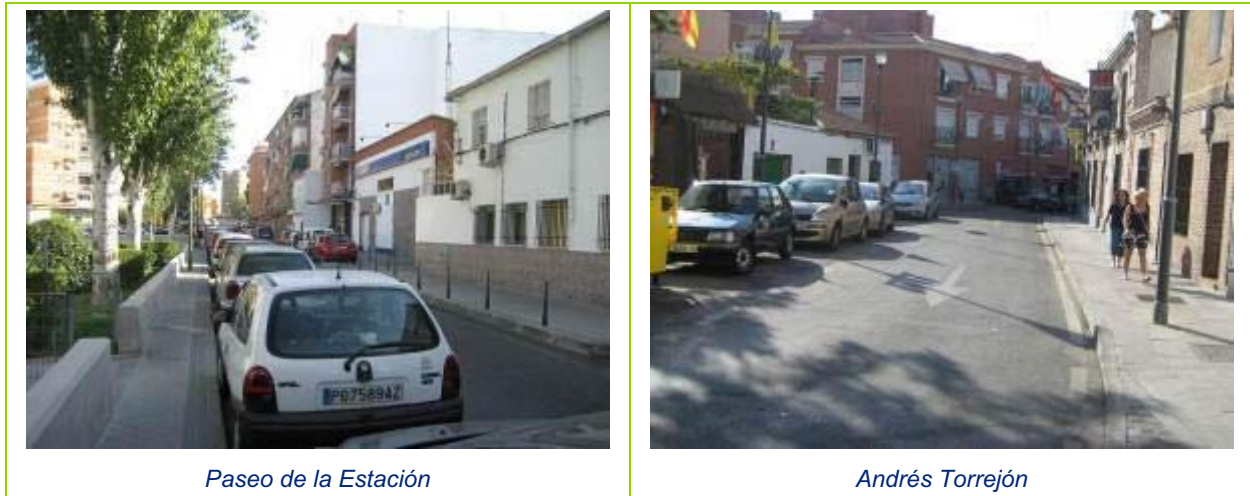
Ilustración 23 Itinerario 10. Estación Móstoles Central