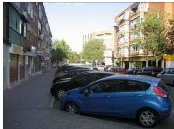
Calle Camino de Leganés