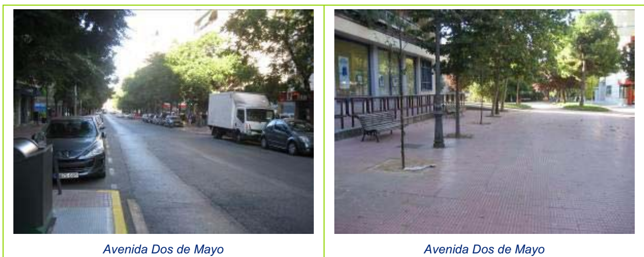
Avenida Dos de Mayo