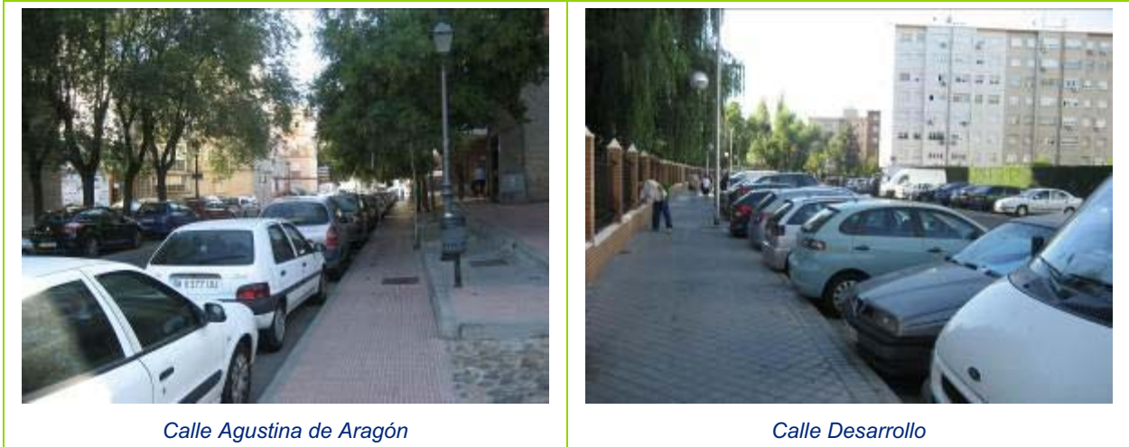
Calle Agustina de Aragón