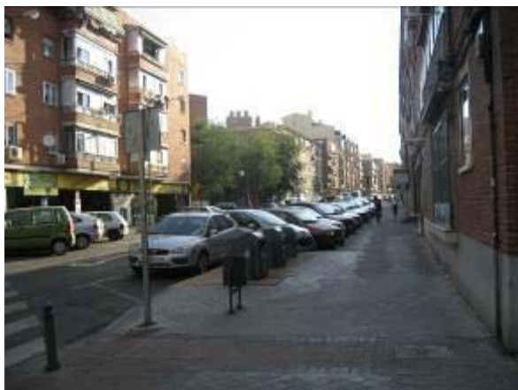
Calle Camino de Leganés