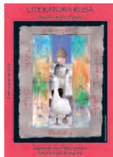
Portada del programa del ciclo "Literatura Rusa"