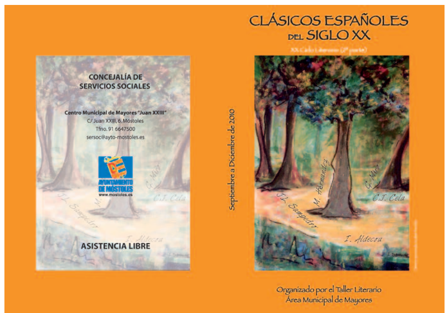
Portada del programa “Clásicos Españoles del Siglo XX”

R: En la actualidad el Departamento de Lengua no imparte la asignatura de Teatro, aunque sí existe como actividad extraescolar. Este grupo de teatro ha montado una obra de creación colectiva. Los alumnos de nuestro Instituto, como viene haciéndose desde hace muchos años, han acudido como público a varias obras. Y también participan en el concurso de carteles de la Muestra (de hecho, han ganado en bastantes ocasiones).