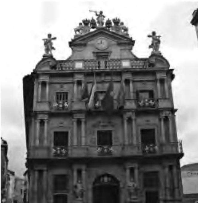
Ayuntamiento de Pamplona

La actual catedral de Pamplona se asienta sobre el lugar que ocupó el capitolio romano. Empezó a construirse en 1394 con Carlos III el Noble. La fachada construida en 1783 por Ventura Rodríguez parece la de un templo griego: el edificio no gustó a los pamploneses, el artista se enfadó y se marchó sin terminar las esculturas de la fachada. El interior es del más puro estilo gótico. La planta es de cruz latina, con tres naves y capillas entre los contrafuertes. En un retablo del S.XV se encuentra un apóstol con gafas y en la nave central reposan los restos del rey Carlos III y de su esposa Leonor de Trastámara.