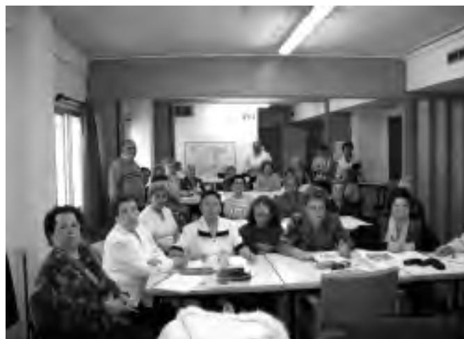
Un aspecto de los alumnos y profesores de las Aulas de Formación

La pareja en la roca, miraba aquel paisaje maravilloso, rodeados de plantas en flor; decían: Es el mes más feliz de nuestras vidas. -¡Se les notaba! De nuestras vidas.