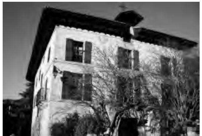
Vera de Bidasoa. Casa de los Baroja

ESTELLA, donde el románico se hace laico: se funda en 1090 para atender a los peregrinos y es tan monumental que se le llama la pequeña Toledo.