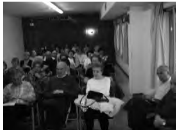
Aspecto de la sala durante una tertulia

Teófilo viendo cerca la muerte pide confesión y entre otras cosas dice que él fue quien robó los cuarenta duros a Antón Tejero y pide que en su nombre les sean restituidos. D a Juanita aprovecha el momento y confiesa a su hijo a solas que no es hijo de quien con ella se casó, sino del que era coadjutor de la parroquia. Le pide perdón y Teófilo se lo otorga. Unos días antes de su muerte Teófilo ruega a Alberto que cuando vea a Rosina le diga que él la perdona de todo corazón y desea que sea feliz con Fernando. El mismo día de su muerte, llegan a Madrid Rosina y Fernando de paso para París. Alberto no les dice nada de la muerte de Teófilo. Se encaminan al teatro donde Verónica bailó con más brío e inspiración que nunca.