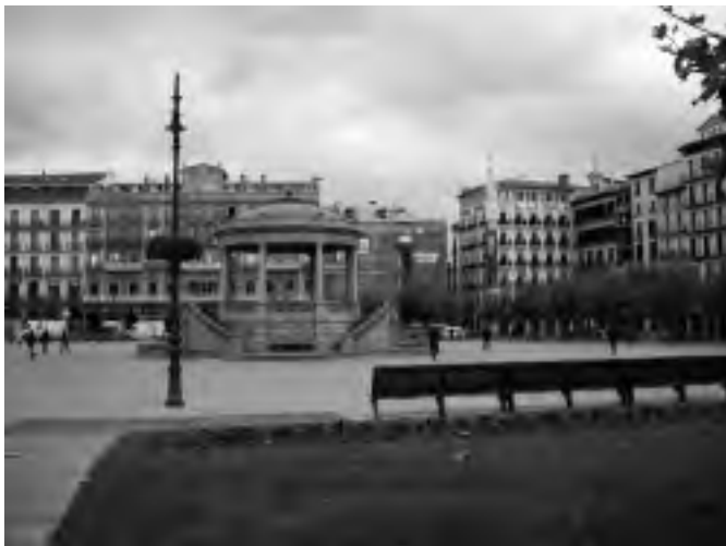
Pamplona. Plaza del Castillo

Muy cerca del embalse de Besa, está el monasterio benedictino de San Salvador de Leire. Con él se inicia el románico en España. Una sencilla portada románica da paso a la cripta que data del año 1000, por deseo del rey Sancho el Mayor. Es de planta cuadrada con naves separadas por capiteles colosales que descansan sobre columnas enanas. En el S.XIV los cistercienses hicieron una nueva ampliación, en estilo gótico, conservando la cabecera románica.