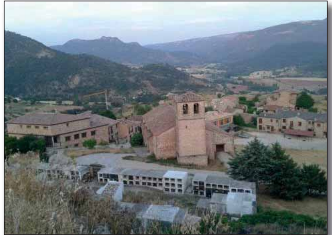
Foto de Riópar desde el castillo.

La ruta comienza en Alcaraz, villa a la que habremos llegado atravesando las llanuras manchegas. El poblado ibero de Urcesa y la musulmana Al Karrash, que se mantuvo bajo dominio árabe durante más de tres siglos, fueron los antecedentes de esta villa. Tras su reconquista en 1213 desempeña un papel estratégico en la toma del reino de Murcia y el avance cristiano hacia el sur. La Plaza Mayor está dominada por los perfiles de la torre de la iglesia de la Trinidad y la civil Torre del Tardón. Al templo, del siglo XV, se accede desde una pequeña placita anexa, por una portada principal del gótico flamígero. En cuanto a la Torre del Tardón, construida a mediados del siglo XVI y decorada con hermosos motivos renacentistas, esta adosada a la lonja de Santo Domingo, levantada en el siglo XVI, se utiliza en la actualidad como centro de reuniones y sala municipal de reuniones. Podríamos citar otros muchos monumentos (lonja de Santo Domingo, y la Regatería; el arco de la Zapatería y la casa de la Carnicería; la iglesia de San Miguel Arcángel; etc.). Fuera de la población, a 6 km, se halla el Monasterio de Nuestra Señora de Cortes, obra del siglo XVII levantada sobre el antiguo templo del santuario, cuya tradición, renovada cada año en las singulares fiestas de finales de agosto en honor a la virgen, arranca de 1222. Desde un mirador a la salida de la villa podemos contemplar el profundo valle cuajado de cultivos y arboledas de extraordinario colorido.