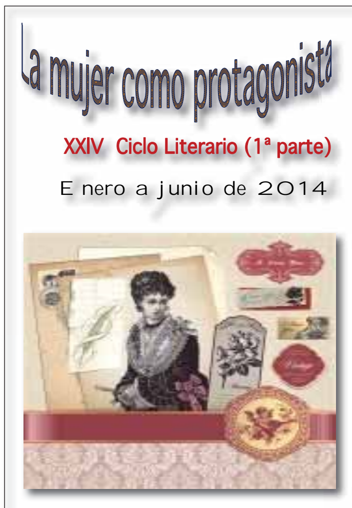
Ciclo Literario: “Mujer como protagonista”.

Y para dar fin al ciclo, se llevó a cabo una jornada dedicada a la poesía y que se incluyó en la XXV Quincena Cultural de los Centros Municipales de Mayores a finales Mayo. ●