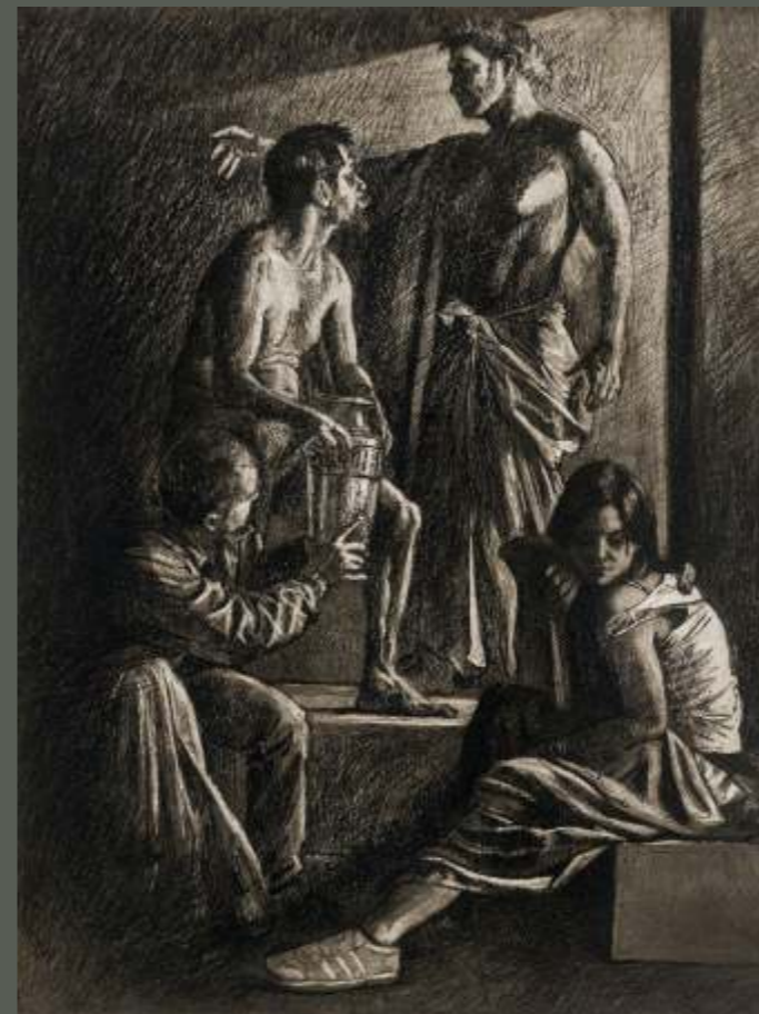
La ofrenda, acto barroco