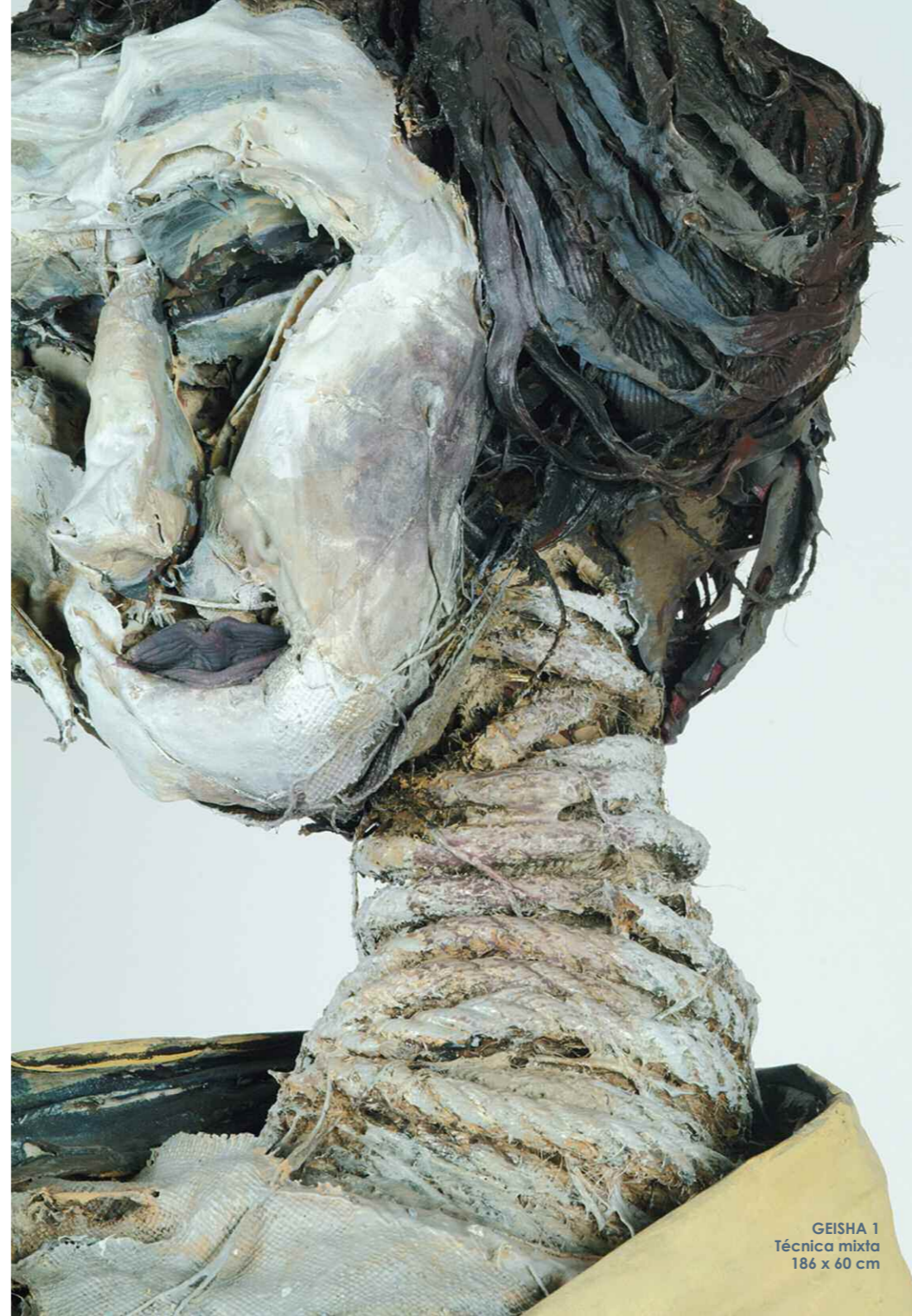
GEISHA 1 Técnica mixta 186 x 60 cm

En un mundo cautivador de tradición, y a la vez modernidad, que se ofrece como contraste —paradójicamente liberador— al otro Japón que lidera la tecnología mundial.