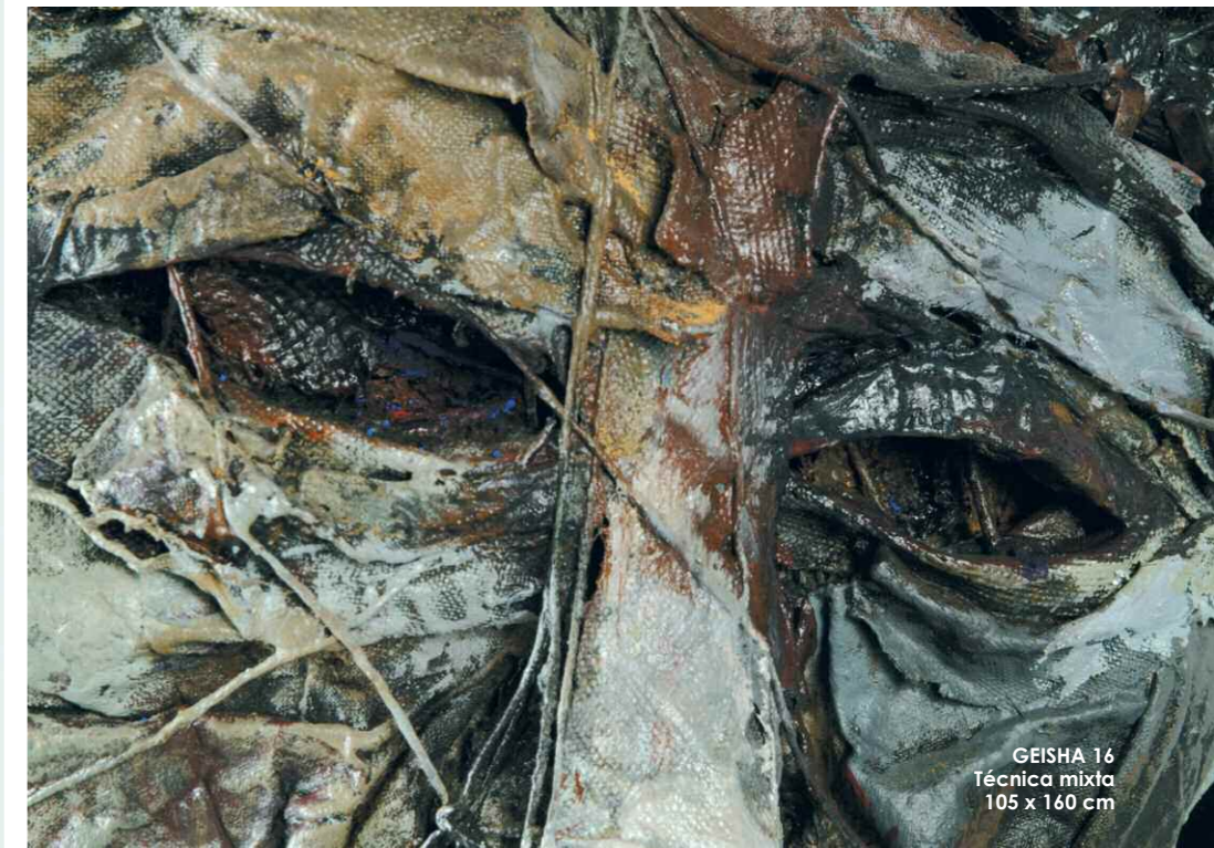
GEISHA 16 Técnica mixta 105 x 160 cm