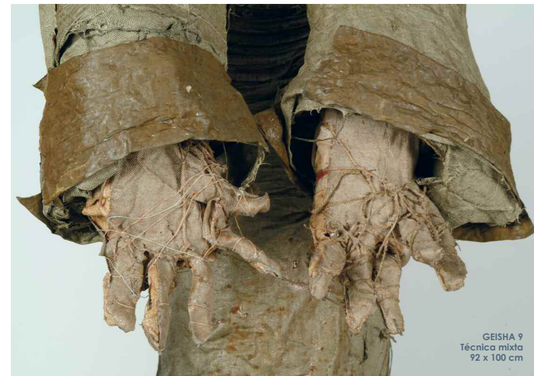
GEISHA 9 Técnica mixta 92 x 100 cm