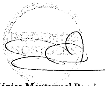
Mónica Monterreal Barrios Portavoz Grupo Podemos