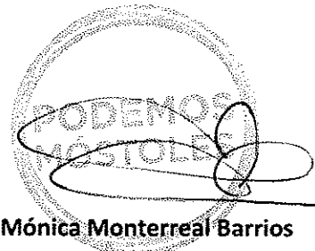
Mónica Monterreal Barrios Portavoz Grupo Podemos