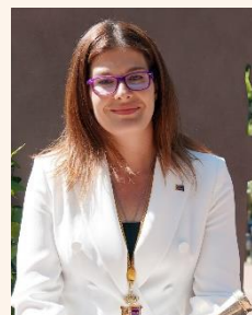
Noelia Posse Gómez Alcaldesa de Móstoles.

Qué feliz me siento, y qué orgullosos debemos estar. Todo es gracias al esfuerzo de todos, al resultado de nuestra historia.