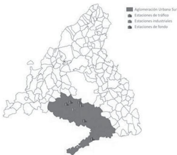
Mapa 3. Zona 3. Aglomeración Urbana Sur.