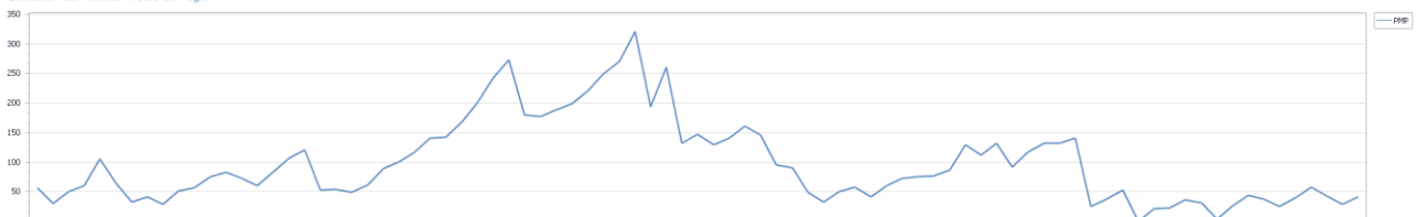
Evolución del Periodo Medio de Pago