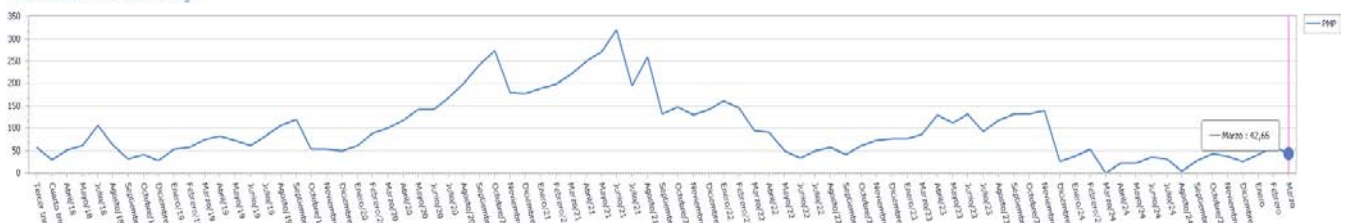
Evolución del Periodo Medio de Pago