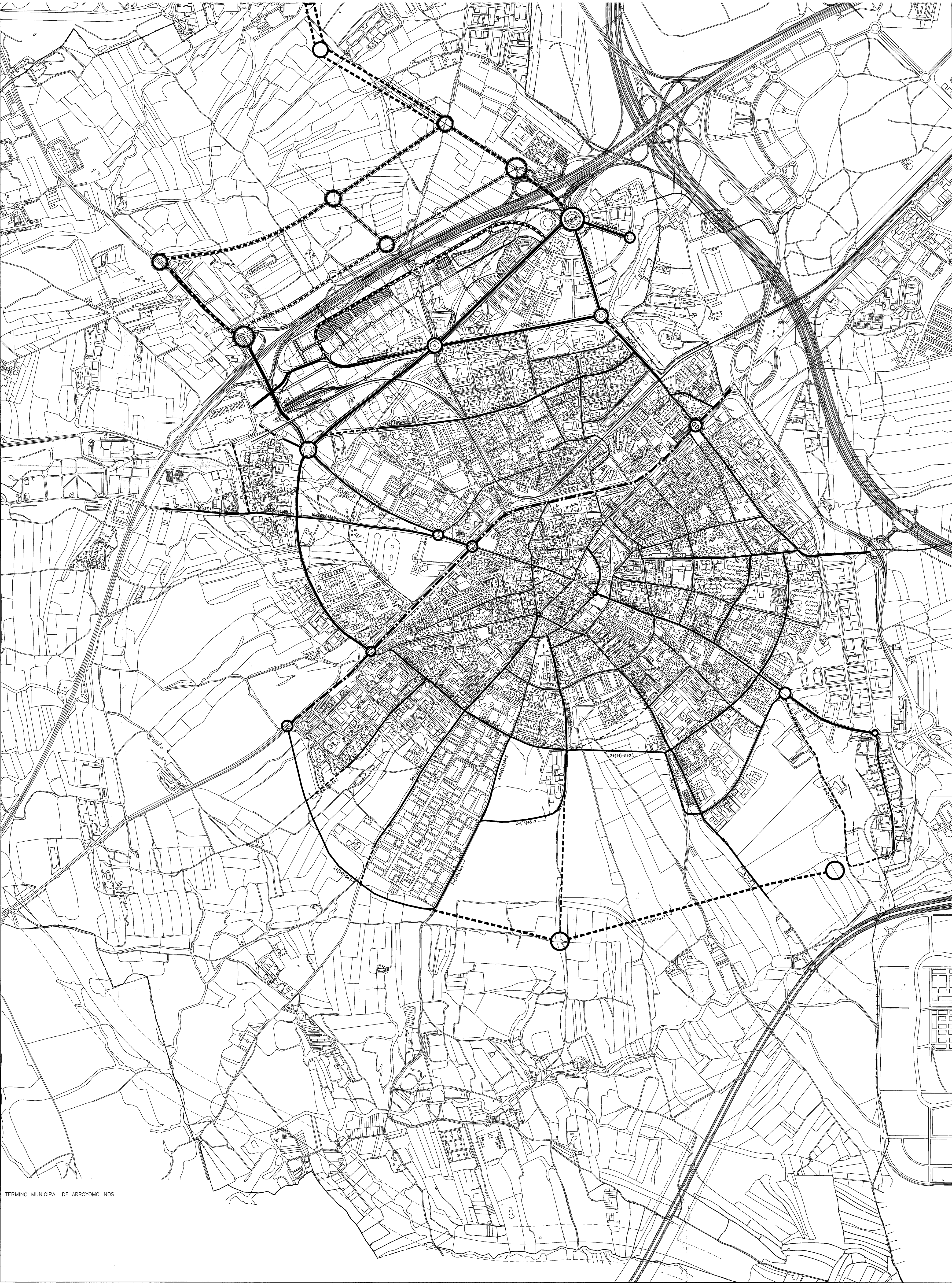
ESTRUCTURA VIARIA ESTABLECIDA EN EL PLAN GENERAL DE MOSTOLES