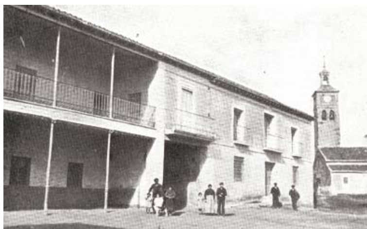
▲ Plaza del Ayuntamiento