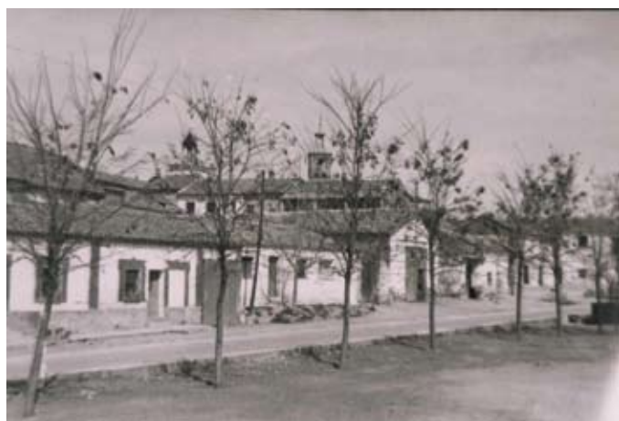
▲ Barrio de Móstoles