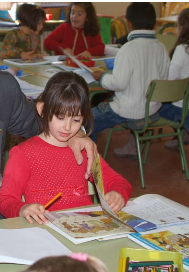
Un cuento explica a los niños la Historia de Móstoles