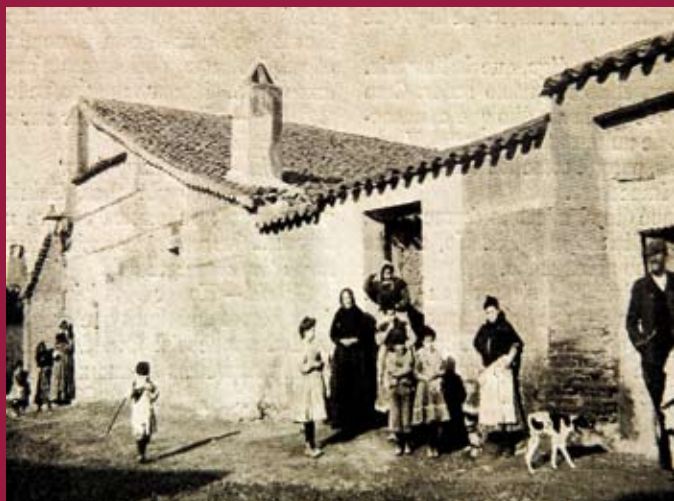
▲ Casa de Andrés Torrejón