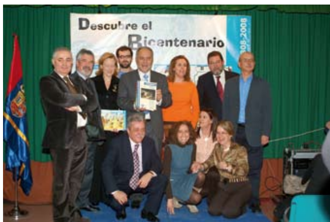
El Alcalde de Móstoles, junto a los autores de las unidades didácticas.