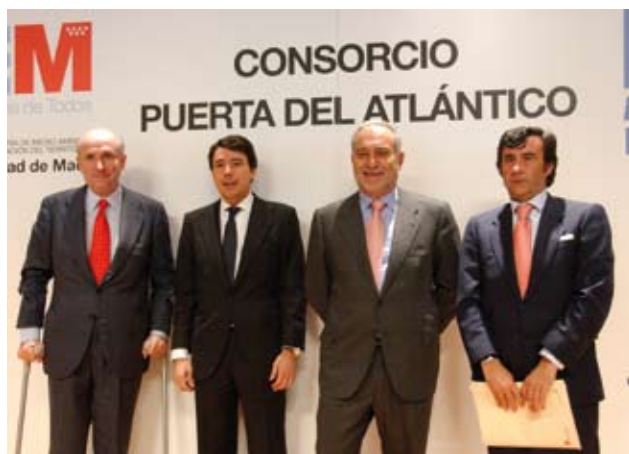
Presentación del Consorcio Puerta del Atlántico

La Comunidad de Madrid, a través del Consorcio "Puerta del Atlántico", que integran a partes iguales el Gobierno regional y el Ayuntamiento de Móstoles, ha puesto en marcha la creación del gran centro internacional de mercancías que se extenderá sobre 100 hectáreas en el citado municipio, una superficie equivalente a cinco veces el recinto ferial de Ifema. El proyecto, que también comprende un Centro de Ocio, supone una inversión global de 600 millones de euros y la creación de 5.000 empleos.