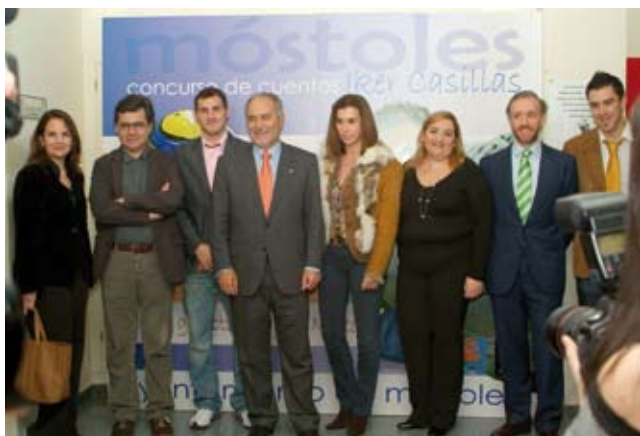
Los componentes del jurado, acompañados por el Alcalde de Móstoles e Iker Casillas.