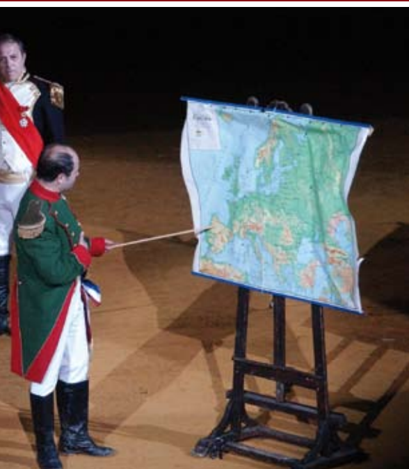
Franceses señalando su objetivo