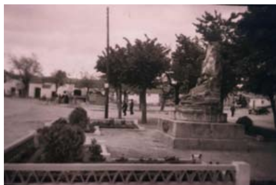
▲ Monumento a Andrés Torrejón