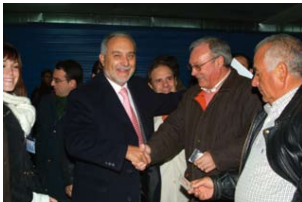
El Alcalde saludó a los propietarios de las plazas del aparcamiento de la Calle Berlín.