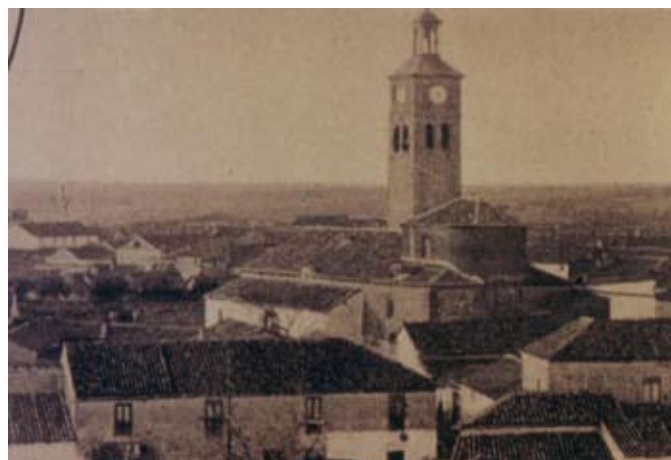
▲ Vista general