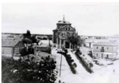
▲ Ermita de Nuestra Señora de los Santos