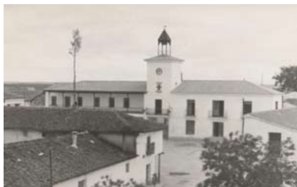
▲ Vista del Ayuntamiento