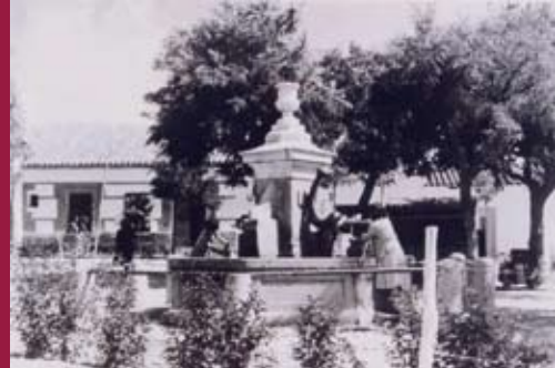
▲ Fuente de los Peces