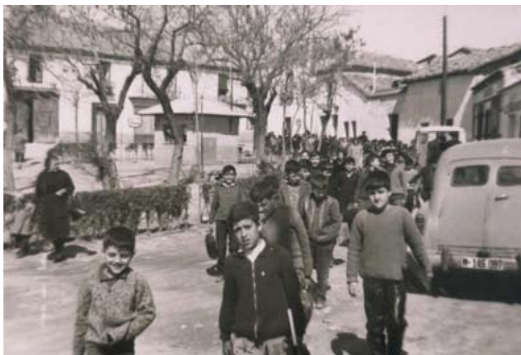
▲ Niños saliendo del colegio en la Plaza del Pradillo