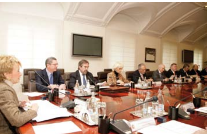
El Alcalde de Móstoles en la Comisión Nacional del Bicentenario