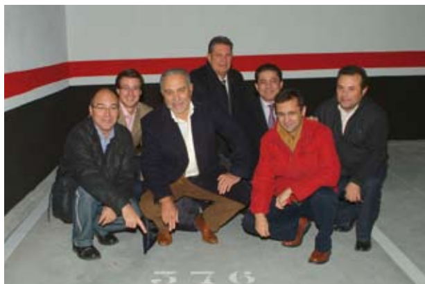
El Alcalde celebró la inauguración del aparcamiento de la Calle Luna

La Segunda Fase (Plan Especial 2008/2011), establece nuevos emplazamientos para la construcción de Aparcamientos Subterráneos según las necesidades comprobadas de los vecinos o que hayan surgido a lo largo del tiempo.