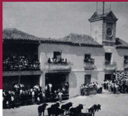
▲ Encierros en la Plaza de la Casa Consistorial