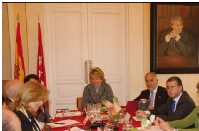
Esperanza Aguirre preside la Fundación Regional

Carlos Herrera, Julia Otero y Carlos Alsina en Móstoles en el Teatro del Bosque