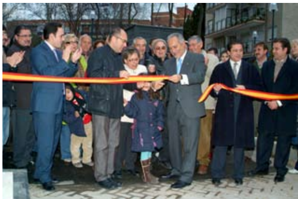
Numerosos vecinos acudieron a la inauguración del aparcamiento de la calle Montecarlo