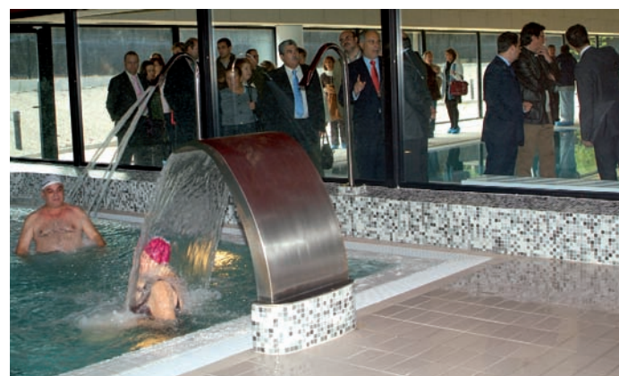
Los vecinos de la localidad ya pueden disfrutar de las piscinas cubiertas y de la zona termal