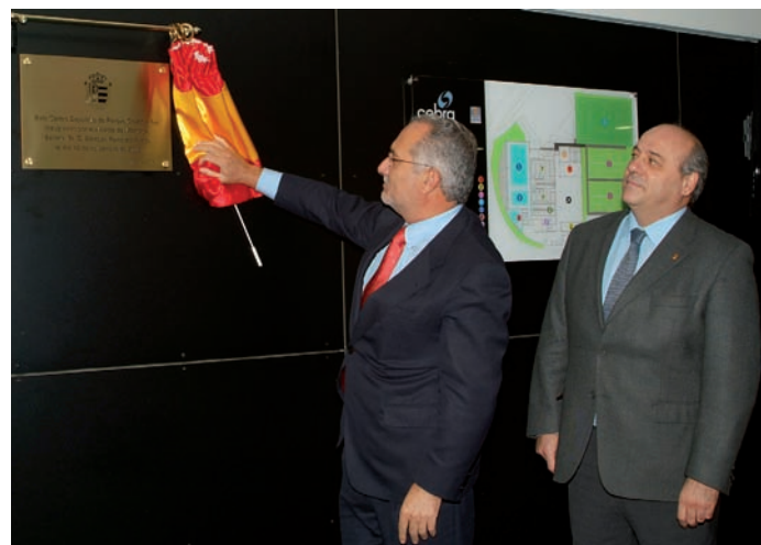
El Alcalde de Móstoles inauguró las nuevas instalaciones deportivas

A todo ello, se suma otra piscina cubierta ubicada en La Fuensanta, cuyas obras comenzarán en breve, y otro gran complejo deportivo en el nuevo barrio Móstoles Sur, así como las obras de mejora que se han hecho en Villafontana.