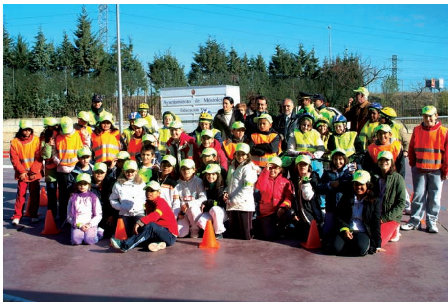
Alumnos del colegio Jorge Guillén que participan en el curso

El contenido del Plan se imparte a través de sesiones teóricas y prácticas a cargo de agentes de la Policía Local. La parte teórica se desarrolla en el aula y consiste en la explicación de los cuadernos de Educación Vial. La parte práctica consiste en el montaje de un circuito en la pista polivalente del centro escolar. En el citado circuito el alumno participa como peatón y como conductor de bicicletas.