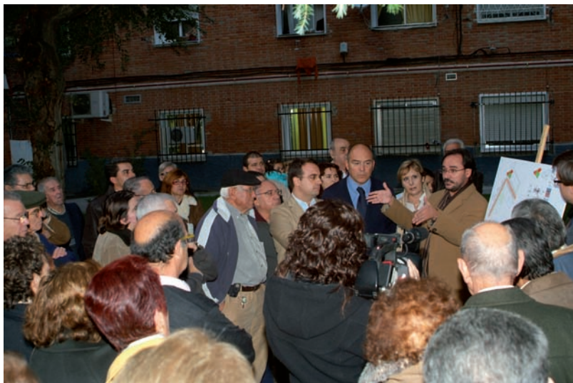
Vecinos de la calle Londres atienden la presentación del Plan