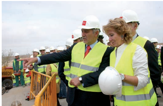
Esperanza Aguirre y Esteban Parro, durante una visita a las obras

L a Presidenta de la Comunidad de Madrid, Esperanza Aguirre y el Alcalde de Móstoles, Esteban Parro, asistieron en Navacarnero al inicio del hormigonado de la futura estación de esta localidad del tren de Cercanías, que está siendo ampliado desde la estación de Móstoles Central y tendrá paradas soterradas en El Soto, Puerta del Atlántico y Parque Coimbra. Junto a José Ignacio Echeverría, consejero de Transportes e Infraestructuras, Aguirre insistió en la voluntad de diálogo del Gobierno regional con Fomento, "por encima de cualquier otra consideración", con el objetivo de prologar la línea férrea Móstoles-Navacarnero para conectar con la red de Cercanías, como lleva reclamando desde hace varios años el alcalde mostoleño.