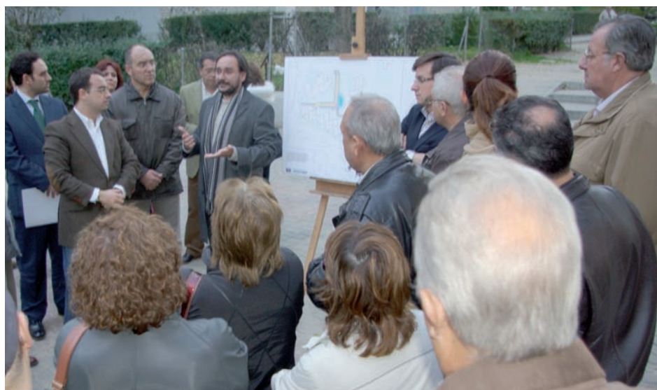
Presentación del proyecto a los vecinos de la calle Helsinki

E l Gobierno local invertirá 450.000 euros en remodelar un tramo de la calle Helsinki, el comprendido entre las calles Helsinki, Nueva York, Carlos V y Veracruz. La obra incluirá el acondicionamiento completo de la zona, con la adecuación de instalaciones de riego y jardinería. Asimismo, se creará una zona con juegos para niños. Instalación de nuevo solado, iluminación, mobiliario y refuerzo de la jardinería. En total, se acometerá la remodelación de 7.500 metros cuadrados.