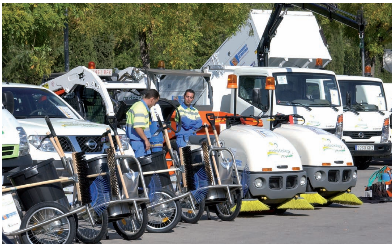
1,5 millones de metros cuadrados de zonas verdes serán mantenidas con la nueva maquinaria