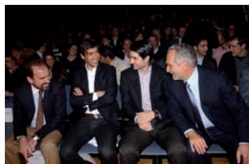
Págs. 20 y 21 -► Premios Ciudad de Móstoles