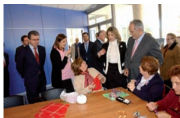
Pág. 11 -► Nuevo centro de mayores La Princesa