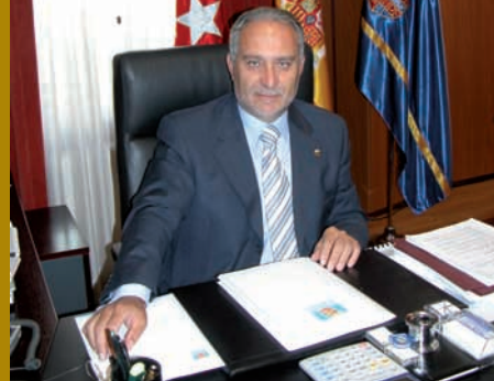
Esteban Parro del Prado, Alcalde de Móstoles