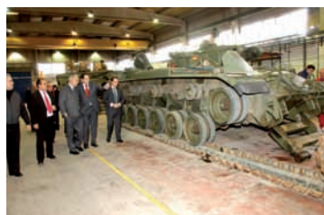
Pág. 9-► 300 nuevos empleos