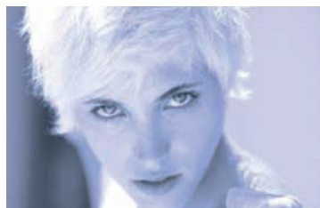
Pág. 36-► A Escena