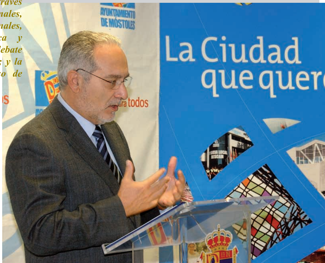
El Alcalde de Móstoles, junto a los portavoces del PP, PSOE e IU

“Será, por encima de todo, un plan para los ciudadanos y participado por los vecinos a través de sus representantes, donde serán esenciales los factores humanos, económicos, políticos, sociales, culturales y mediáticos”.