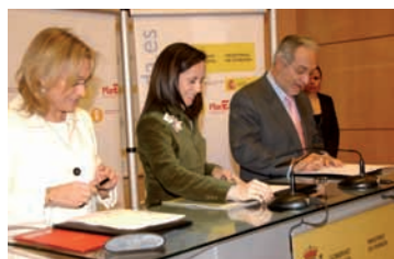
Pág. 15 -► Rehabilitación de Villafontana I