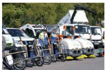
Pág. 32-► Escoba de Oro