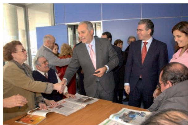
El Alcalde, el Consejero Granados y la Concejala de Servicios Sociales saludando a los vecinos