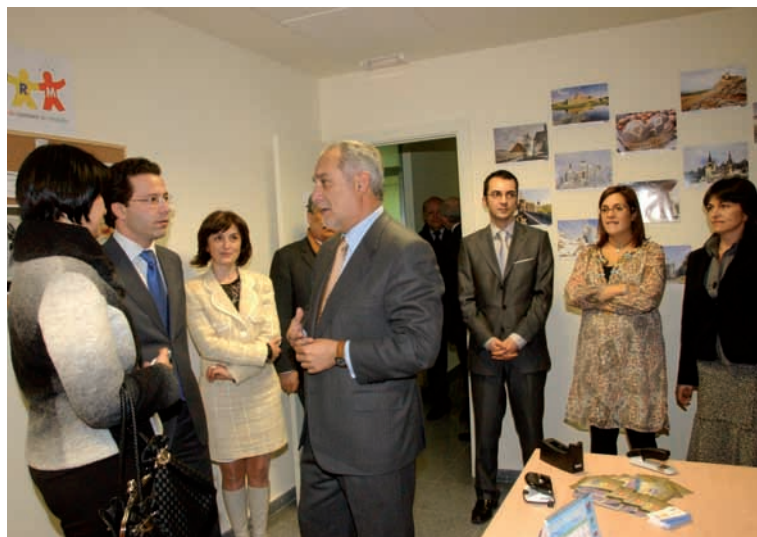
El Alcalde y el Consejero, en el acto de presentación de la nueva sede.

E l Consejero de Inmigración y Cooperación, Javier Fernández-Lasquetty, y el Alcalde de Móstoles, Esteban Parro, han inaugurado la sede de la Asociación de Rumanos de la localidad, compuesta por 5.302 ciudadanos empadronados, lo que la convierte en la más numerosa del municipio. Parro ha asegurado que desde la creación en 2006 de dicha Asociación, “la cooperación entre el Ayuntamiento y este colectivo se ha intensificado y se ha consolidado, como un espejo para toda la región”. La Asociación está ubicada en el Centro de Participación Ciudadana, sin duda, “un símbolo de la normalidad que hay en Móstoles en la convivencia entre españoles e inmigrantes. Porque las asociaciones son el nexo entre los ciudadanos y el Ayuntamiento, de cuyas sinergias se beneficia una ciudad que es la que mayor capital humano tiene de toda la región”.