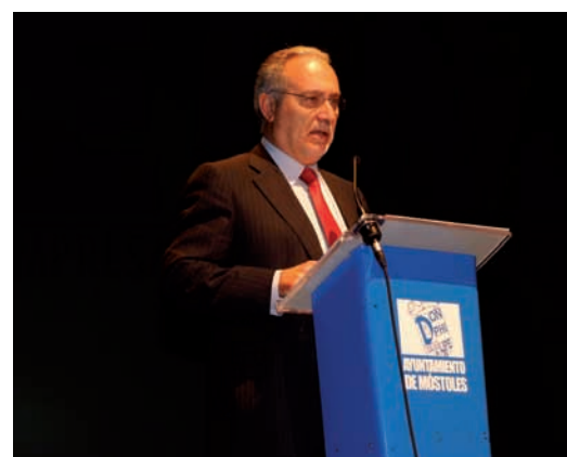
El Alcalde (arriba) y el Concejal de Urbanismo y Teniente de Alcalde de Desarrollo de la Ciudad (abajo) en la presentación del Plan

Con el nuevo plan los ciudadanos tienen la oportunidad de adquirir como propietario su plaza, sin necesidad de sorteo, ya que su venta se realizará por orden de presentación de solicitud firme. Una vez adquiridas las propiedades, y sólo después de ello, el Ayuntamiento, a través de la Empresa Municipal de Aparcamientos (EMA), procederá a la construcción del emplazamiento que, continuando con la misma línea de trabajo, ofrecerá magníficas calidades de construcción, dimensiones superiores a las de la media del mercado y un precio sensiblemente inferior.