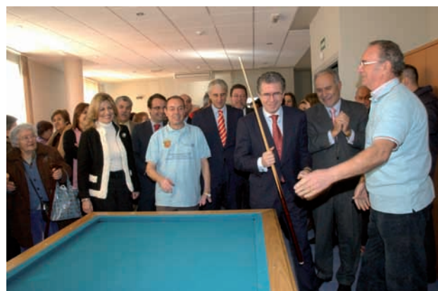
Sala de juegos de mesa del nuevo Centro

En unos meses se terminará la construcción de un nuevo espacio para las personas mayores en el barrio de Parque Coimbra y está prevista la construcción de otro en el barrio Móstoles Sur.