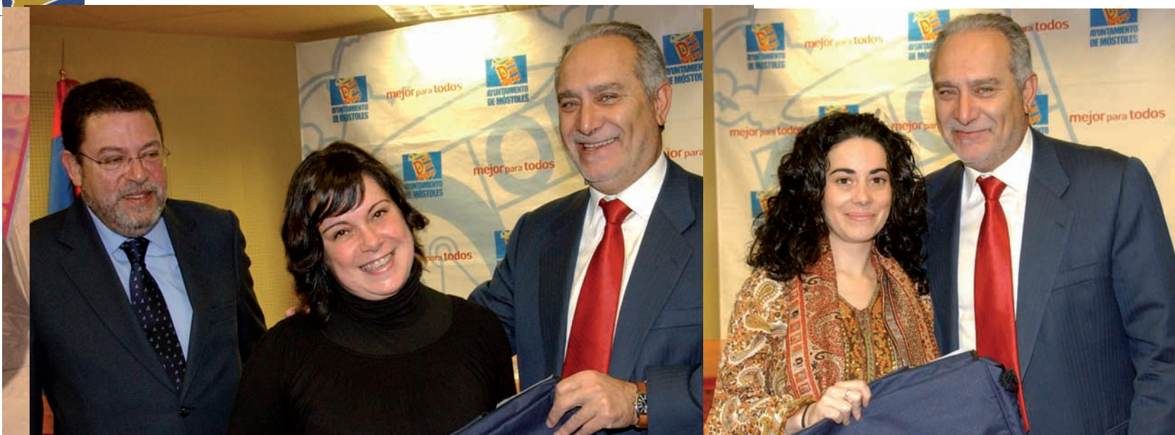
Varios vecinos agradecidos, recibiendo las llaves de manos del Alcalde

E l Instituto Municipal del Suelo (IMS) ha entregado ya 172 viviendas en régimen de alquiler con rentas de 250 euros, destinadas principalmente a los denominados mileuristas. La última entrega ha correspondido a 32 pisos de esta tipología, 14 de ellas de la promoción número 48 (ubicadas en la avenida Estrella Polar) y 18 vinculadas a la promoción 50 (situadas en la calle Rigel), ambas en el nuevo barrio Móstoles Sur.