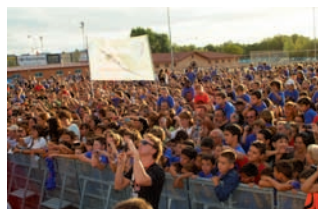
► Iker Casillas nombrado hijo predilecto de Móstoles. pág. 20 y 21