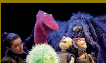
pág. 36 a 39 ► Programación de ocio y cultura.