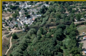
pág. 14 ► Vía Verde Móstoles- Almorox y marcha ciclista.