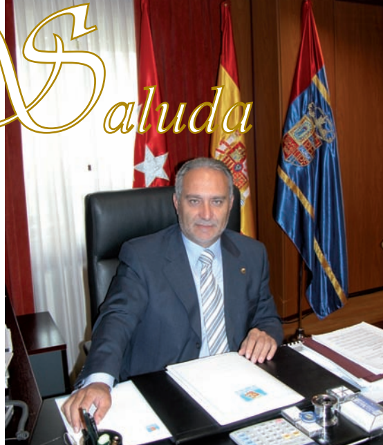
Esteban Parro del Prado, Alcalde de Móstoles