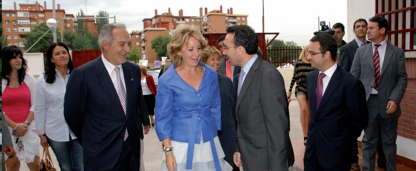
Esperanza Aguirre en la visita al Instituto Juan Gris.