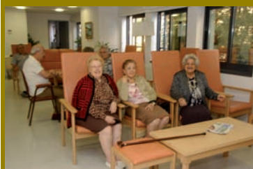
pág. 18 ► Nuevo Centro de Servicios Sociales.