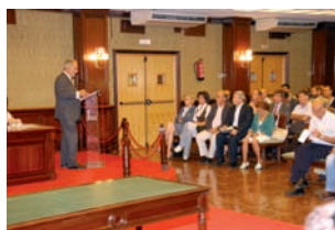
► Debate Estado del Municipio. pág. 6 a 11