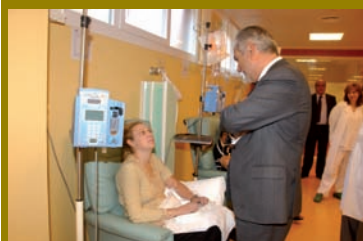
pág. 16 ► Hospital de día, Hospital Universitario .