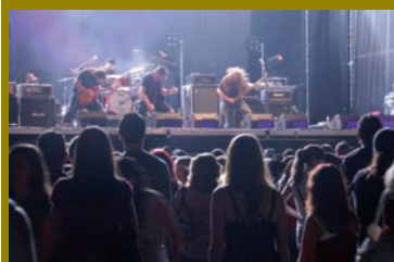
pág. 22 y 23 ► Reportaje fiestas patronales.