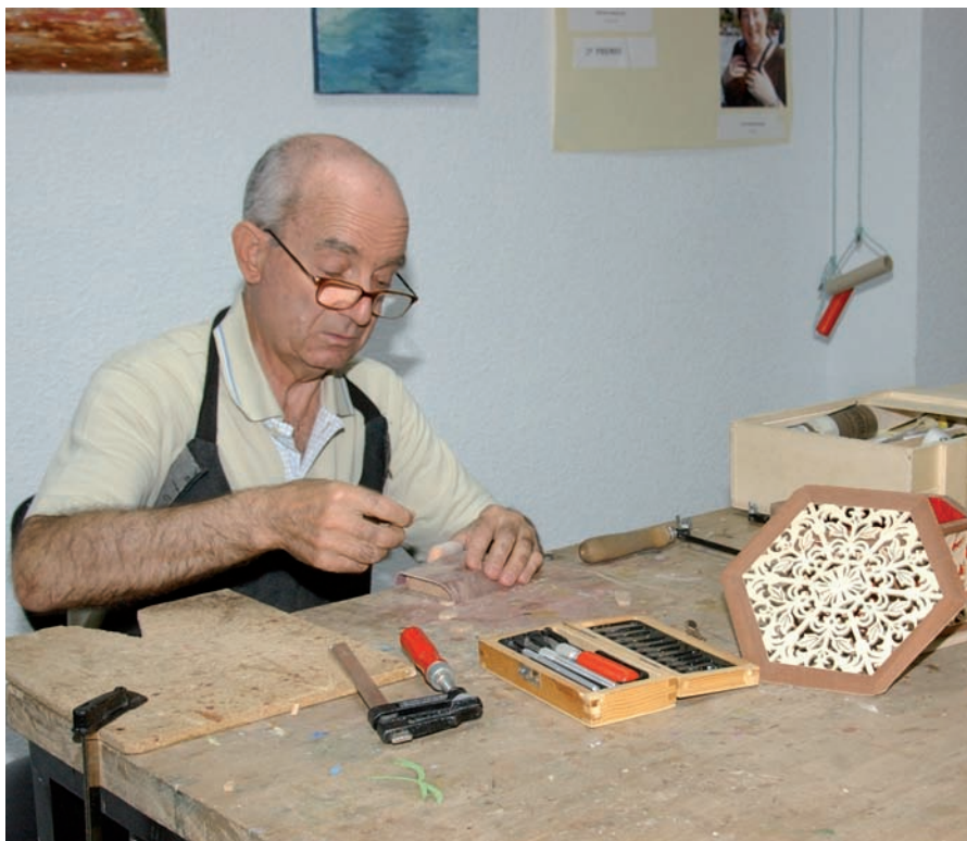
La atención a mayores será uno de los programas a desarrollar en el nuevo centro.

E l nuevo barrio de Móstoles Sur tendrá un Centro de Servicios Sociales, cuyas obras serán financiadas por la Comunidad de Madrid, a través del Plan Prisma. En el nuevo centro, con un coste de 2,9 millones de euros y una superficie total de 2.700 metros cuadrados, se contempla la incorporación de las últimas normativas de mejora de la accesibilidad y en él se instalarán las oficinas destinadas a desarrollar los diferentes programas de la Concejalía de Servicios Sociales, tales como atención primaria, prevención de la exclusión, atención a la familia y mayores.