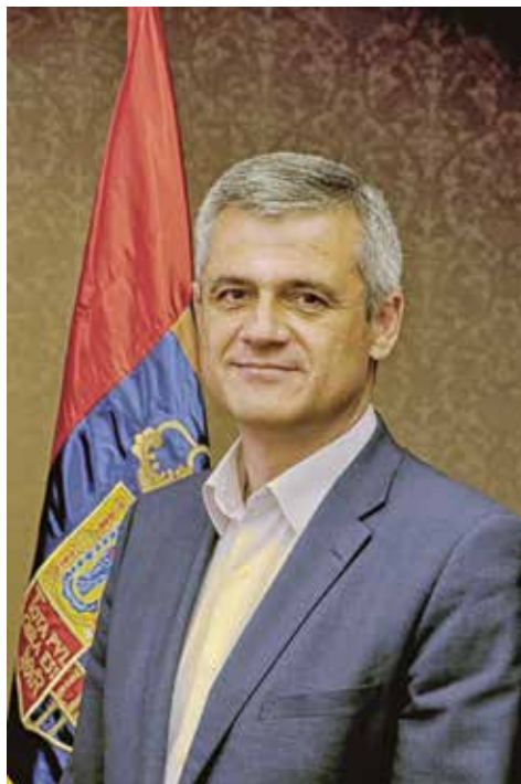
David Lucas Parrón Alcalde de Móstoles

Así pues, sabiendo las dificultades y conociendo la realidad mostoleña por la que desde el Equipo de Gobierno nos volcamos por mejorarla, os invito a que dejéis aparcado por unos días los quehaceres, para disfrutar junto a amigos y familiares de estos días de alegría y diversión. Me despido de todos vosotros y vosotras en la segura confianza de encontrarnos durante estas fiestas y compartir estos días en amistad y armonía. Un saludo de vuestro alcalde.