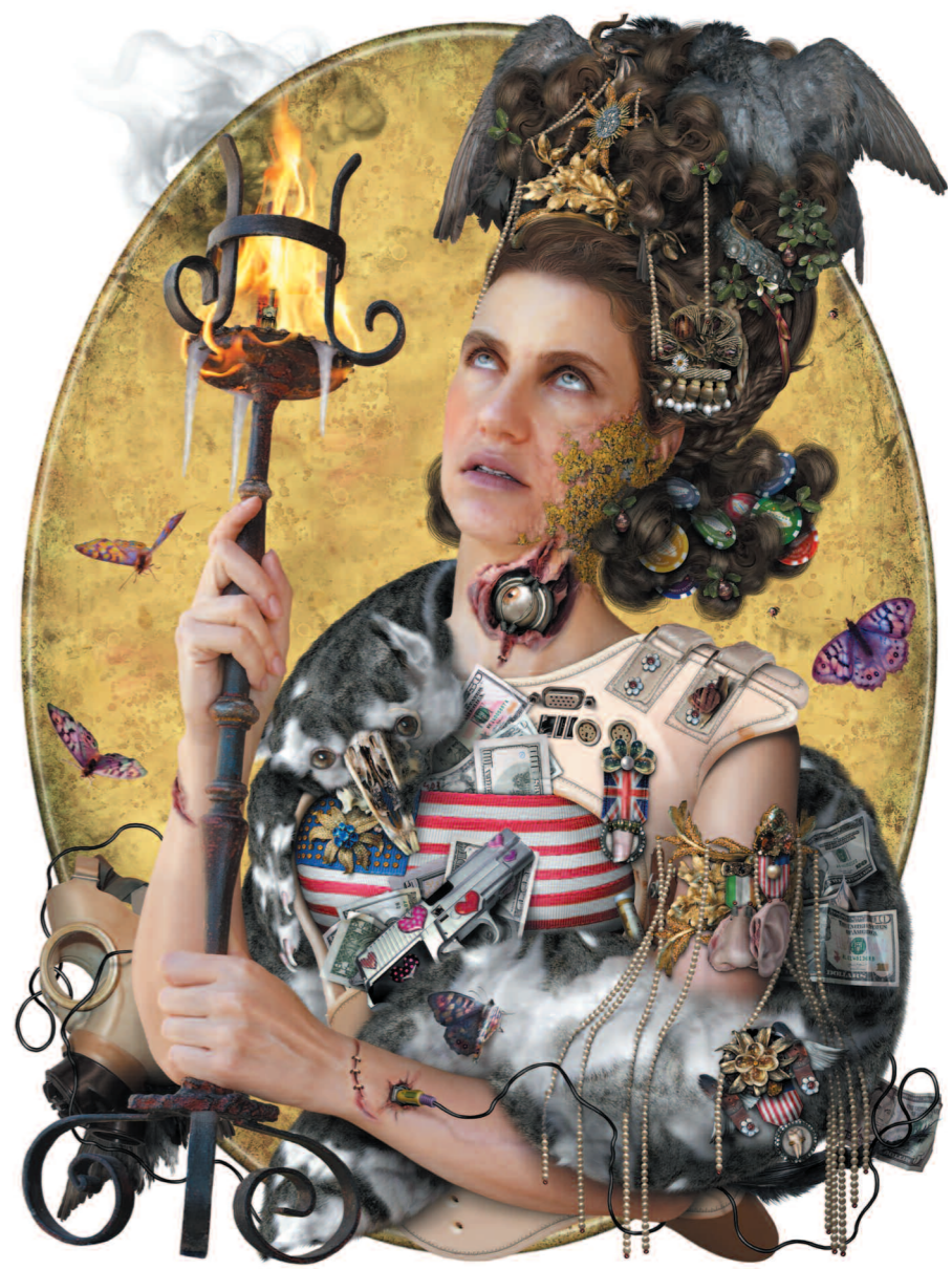
Fotomontajes serie Vanitas medidas variables