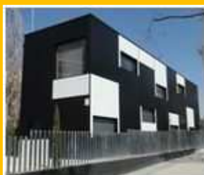
CENTRO DE SERVICIOS PARA JÓVENES

Para la realización del bautismo de buceo será imprescindible aportar el día de su realización un certificado médico que indique que no se padece ninguna enfermedad que impida practicar el submarinismo.