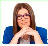
Noelia Posse Alcaldesa de Móstoles