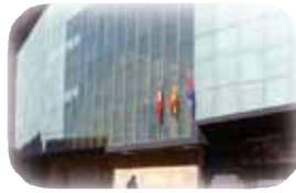
Centro Arte Dos de Mayo CA2M