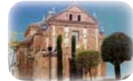
Ermita Ntra. Sra. de los Santos