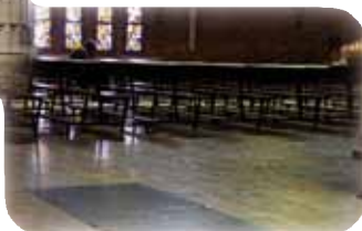
Sepulcro de D. Andrés Torrejón