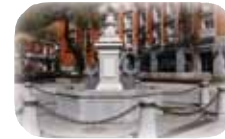
Fuente de los Peces