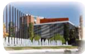
Teatro del Bosque