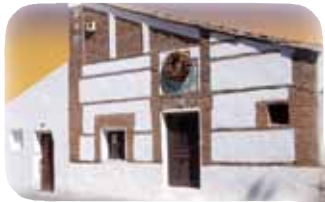
Casa Museo Andrés Torrejón

Sepulcro de D. Andrés Torrejón. El 17 de agosto de 1812 murió a la edad de 75 años. Su sepulcro se conserva en la capilla de Nuestra Señora de la Soledad de la Iglesia Parroquial.