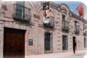
Museo de la Ciudad