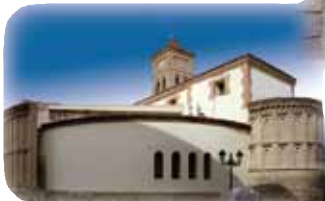
Nuestra Señora de la Asunción