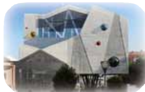
Antiguo Casino-Instituto de la Mujer y Archivo Municipal

Teatro del Bosque. Este edificio contemporáneo es obra del arquitecto Miguel Verdú y su novedoso jardín perimetral fue diseñado por Javier Mariscal. Se inauguró en el año 2003, y en él se realizan los principales espectáculos de Artes Escénicas de la Ciudad como Teatro, Música y Danza.