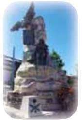
Monumento de Andrés Torrejón