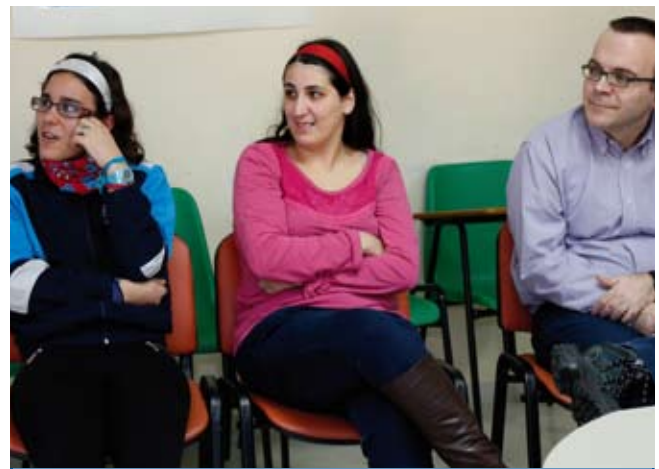
10:30 h. Los alumnos consultan sus dudas y escuchan atentamente las explicaciones de la Policía Municipal.