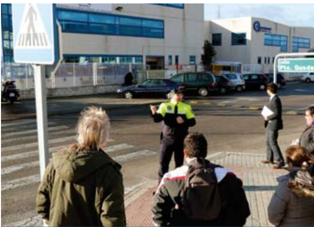
12:30 h. Los alumnos refrescan algunas de las señales que encuentran a su paso..