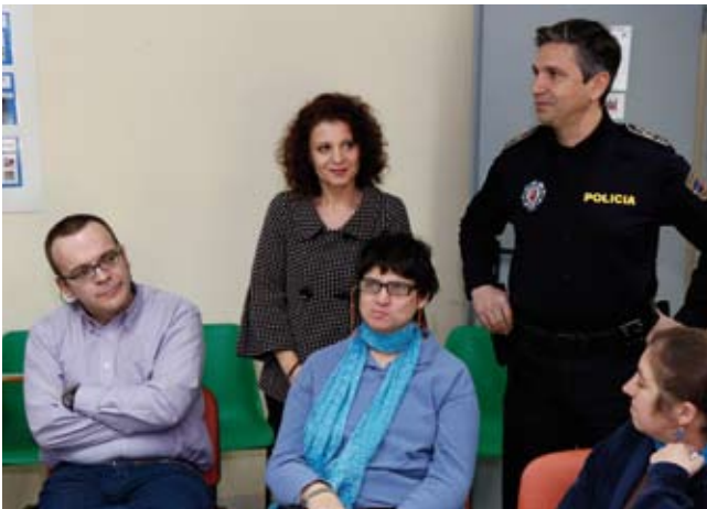
12:00 h. Hora de intercambiar experiencias: "Hay gente que cruza sin mirar", comentan algunos sorprendidos.