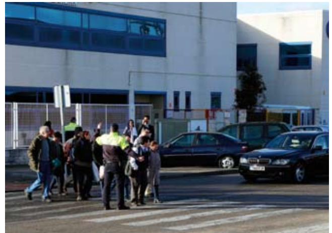
12:30 h. La clase de educación vial se traslada a las calles de Móstoles de la mano de un agente.