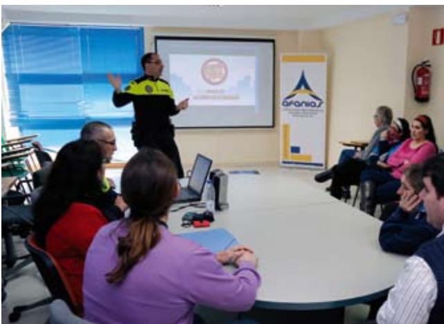
10:00 h. Comienza la jornada de formación dentro del Plan de Educación Vial impartido por la Policía Municipal.