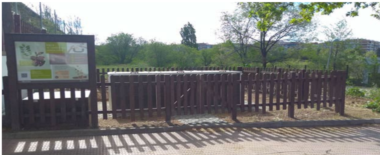
ZONA COMPOSTAJE COMUNITARIO MÓSTOLES. Calle Violeta nº 12

En cuanto al tratamiento de sus residuos, Móstoles dispone de dos plantas de tratamiento de residuos: una planta de transferencia de residuos de construcción y una planta para el tratamiento de residuos de jardinería.